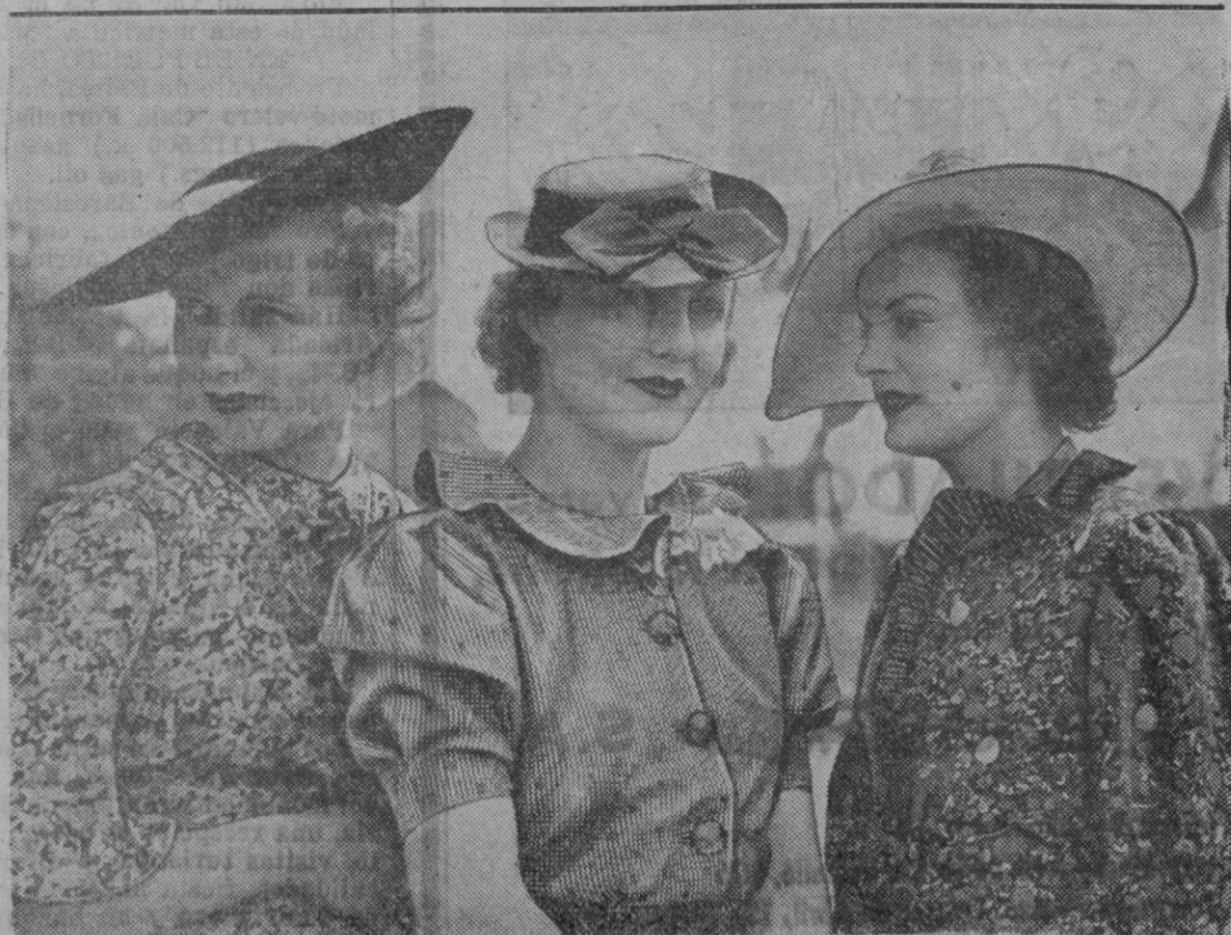
SOMBREROS INGLESES.—Los ingleses se han dado en variar mucho las formas de los sombreros. He aquí tres presentados en Asot que han llamado poderosamente la atención y como se verá cada uno de ellos es de forma diferente

Por lo tanto, cada una de esas partículas de polvo y suciedad que se han introducido en los poros, debe ser extraída, y para esto debe emplearse un método eficiente. Como la piel pierde siempre sus grasas naturales como resultado de su contacto con la intemperie, debe proveerse de nuevo aceite para evitar que la epidermis se,que y aparezcan en ella espinillas.