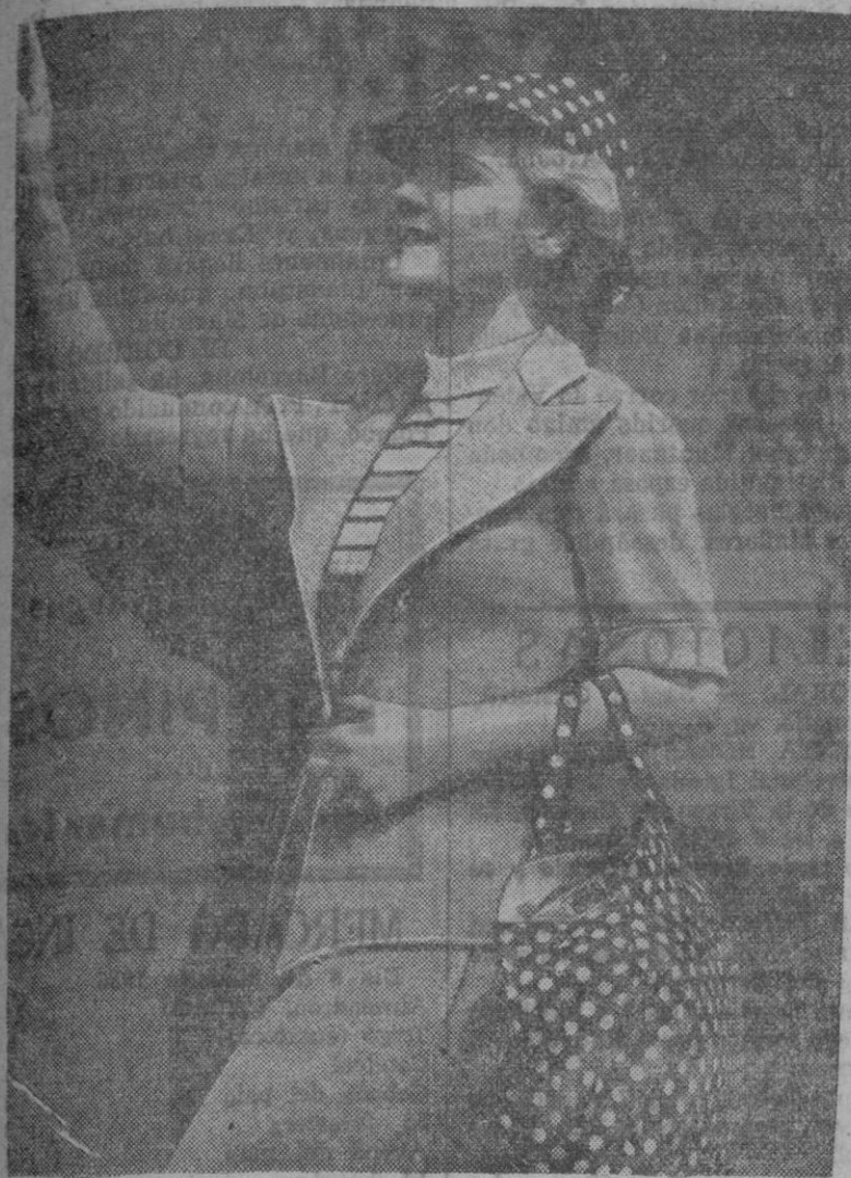
GRIS, AZUL Y ROJO.—Es el color de moda de este verano. Este traje práctico para playa o campo hecho en gris lleva abajo un jersey fino blanco con listas azules y el sombrero y bolso en rojo con lunares blancos es el completo que se adapta en absoluto a los colores de moda.

Cualquier crema sólidamente acreditada sirve para el caso, dándosele, después de un lavado, en forma de masaje y con preferencia por la noche.