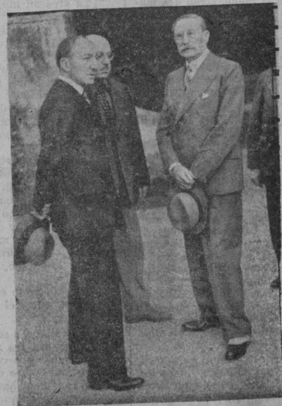
Los Sres. Ybon Delbos, Avenol y León Blum, después de una entrevista con motivo de las actuales reuniones en Ginebra de la Liga de Naciones.

Nos hallamos en un momento bien curioso para las Bolsas. Aunque los derrotistas no quieren creerlo, tienen que rendirse a la evidencia, hay gran