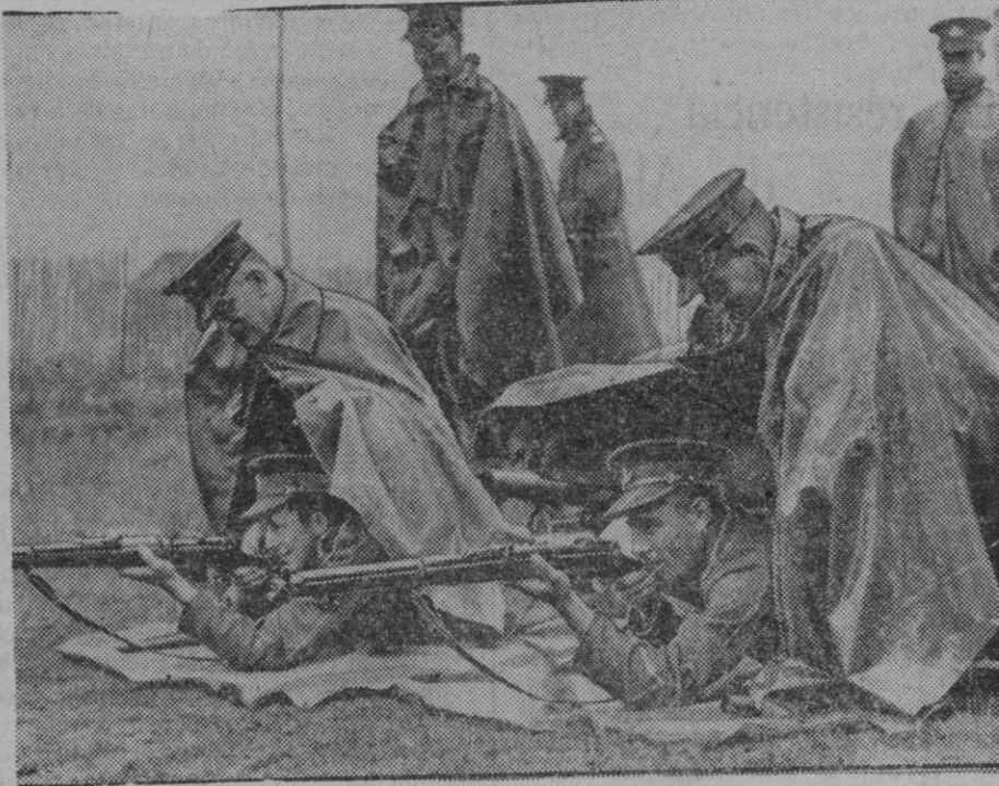
Los ingleses se ejercitan en el manejo de las armas. El Regimiento de Bisley, efectúa aquí en plena lluvia prácticas de tiro.

Mucho nos satisface ver que ésta es la orientación que se sigue en la dirección de nuestra biblioteca municipal.