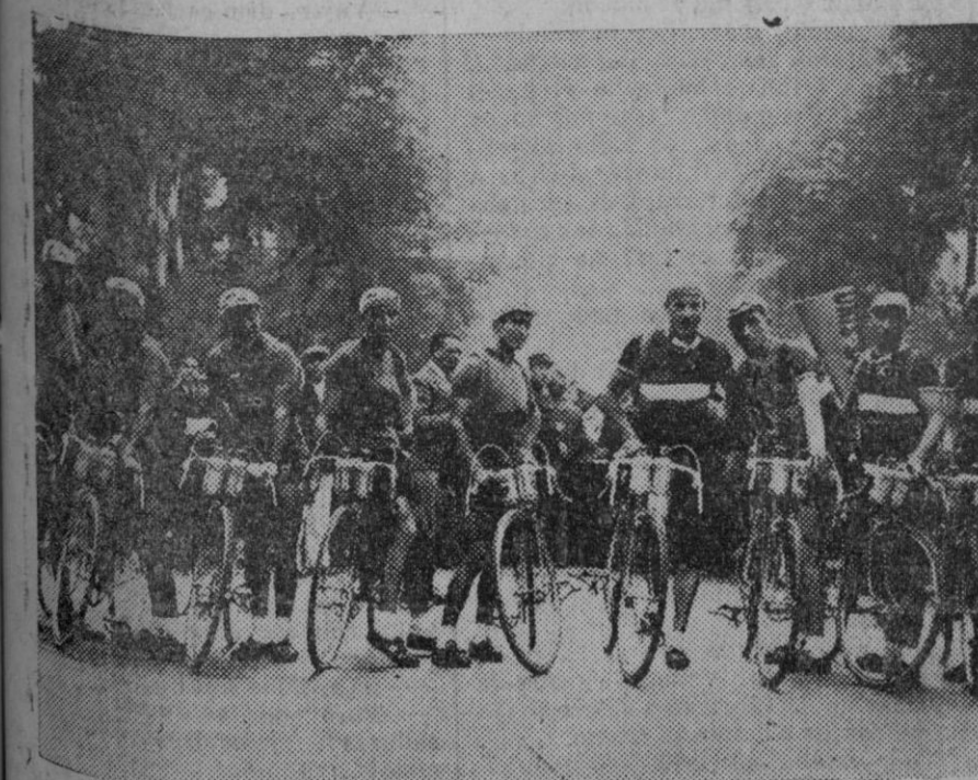
Los equipos de España (a la izquierda) y de Luxemburgo (a la derecha), que toman parte en la vuelta a Francia.