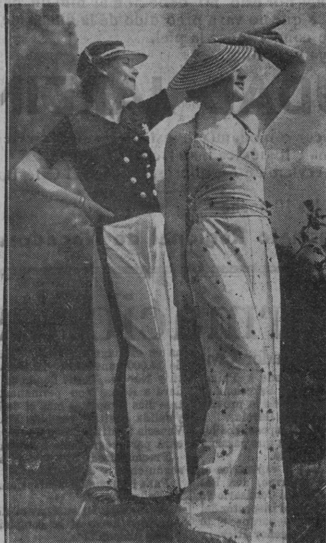
TRAJES DE PLAYA.—Los trajes de playa son la gran novedad. El de la izquierda está formado por un pantalón de cheviot blanco y una chaquetilla de punto abrochada a dos tiras de botones. El otro de la derecha está hecho de cheviot blanco con lunares moteados rojos y el cuerpo también de la misma tela. El sombrero colie es de paja. (Cliché-Mediterráneo)

Las manchas de pintura sobre el tejido de seda pueden hacerse desaparecer saturando la tela en una mezcla de trementina y de amoníaco en partes iguales. Luego lávese con jabonaduras. Séquese entre hojas de papel secante poniendo encima algún objeto pesado.