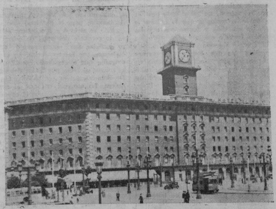
Uno de los Hoteles de la plaza de España, de Barcelona, nuevamente habilitados para hospedar a los atletas que acudirán a la Olimpiada Popular.

Admitimos depósitos en custodia de acciones de nuestro Banco LIBRES DE TODA COMISION.