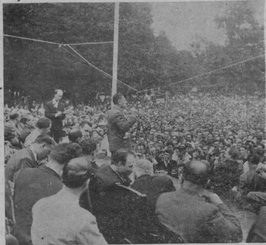
Acto de propaganda de la Olimpiada Popular de Barcelona, celebrado en Garches, Francia, y al cual concurren los Ministros Cot y Lagrange.

Y nos ha causado sorpresa porque ningún otro tramo de carretera hay que más lo necesite.