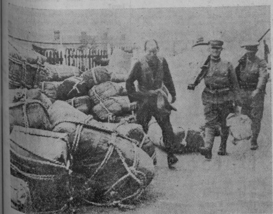
Mercancías del Japón exportadas a China a pesar de la prohibición. Los soldados japoneses custodian la mercancía protegiendo su importación a China.