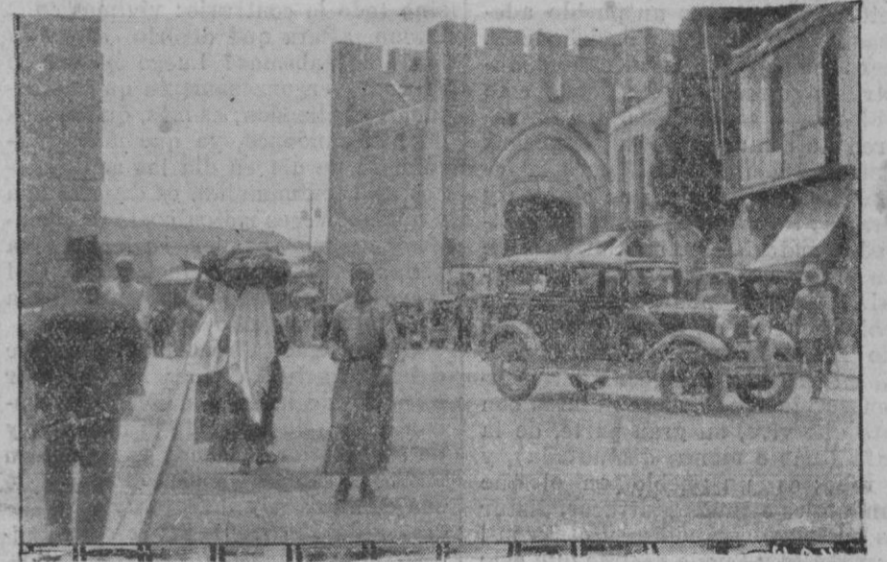
Una calle de Jerusalem en plena actividad. Cliché Mediterráneo

C. E. ROSENBE (Prohibida la reproducción)