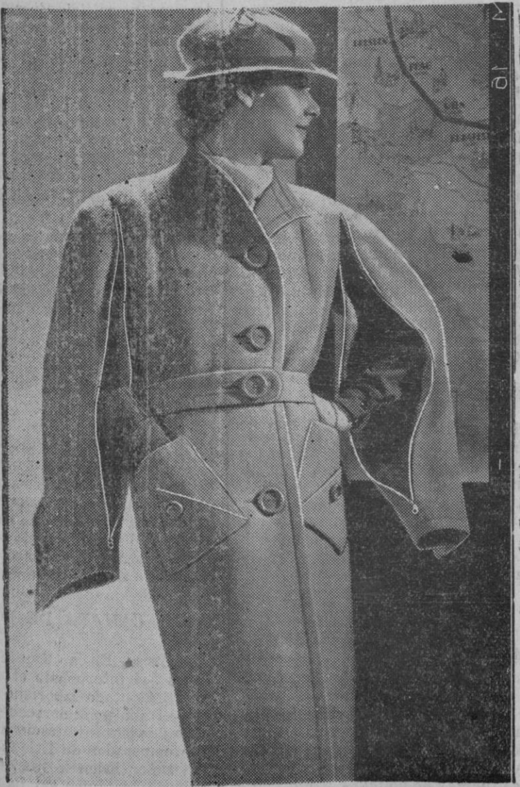
Gabán de Sport y de viaje — En esta manga de viaje, se puede bien notar la novedad de las mangas que por ser abiertas permiten la libertad absoluta que ha sido muy bien recibida por las exaltadas de la moda. ¿Teñirá este éxito el sistema de mangas del gabán?

Los destinos del personal ya se han iniciado. Han sido ellas las primeras víctimas de la jornada. Las economías exigen reducción en los gastos y lo que fué suntuoso y sin par local de gran libación quedará sujeto a una mísera comparación con lo que había sido.