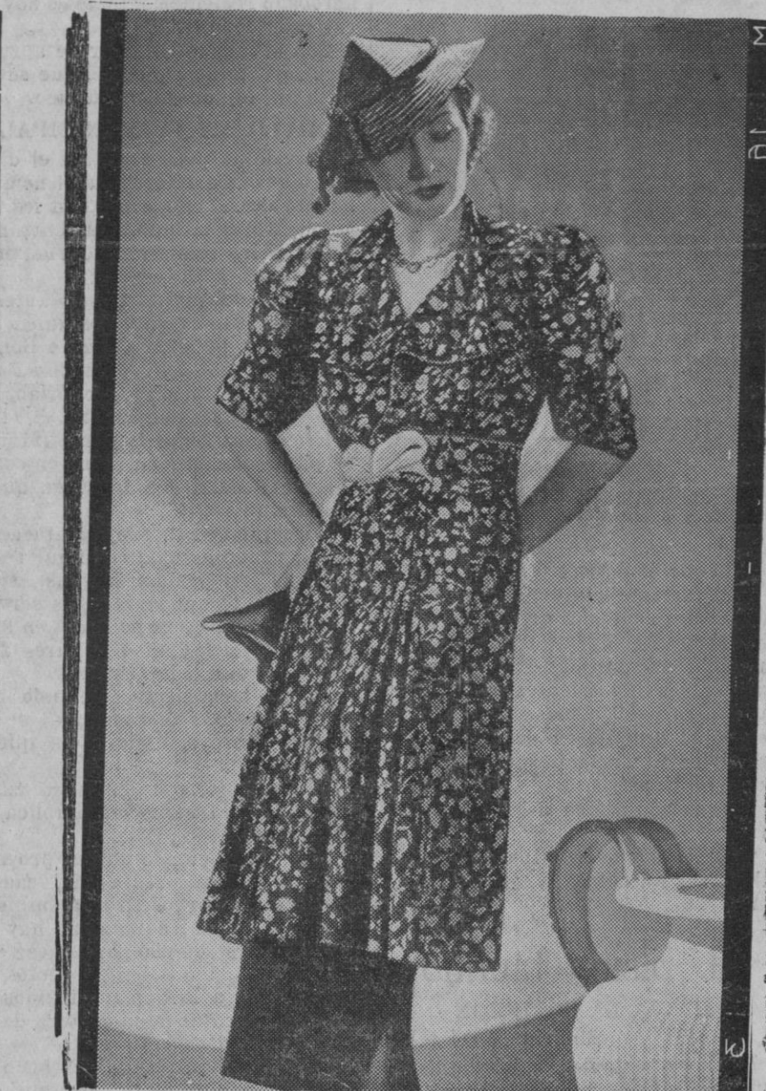
Chaquetón en tela fantasía — Los chaquetones son la gran moda de ahora. Tanto auge están logrando que ya se les ve en los trajes de paseo. En los modelos de verano — como éste de tela fantasía — las mangas son muy amplias y el entalle se logra por un cinturón adherido. También las solapas son cada vez más amplias.

Se echa en la olla, con agua suficiente, un cuarto kilo de judías y se pone al fuego con la mitad de una morcilla, 250 gramos de buen tocino, un chorizo y huesos de codillo y jamón. Cuando las judías estén blandas se les agrega un kilo de patatas partidas en rajas, se hace un cuchifrito en la sartén con dos dientes de ajo, se aparta y se le añade una cucharadita de pimientón dulce, esta mezcla se agrega a las judías.