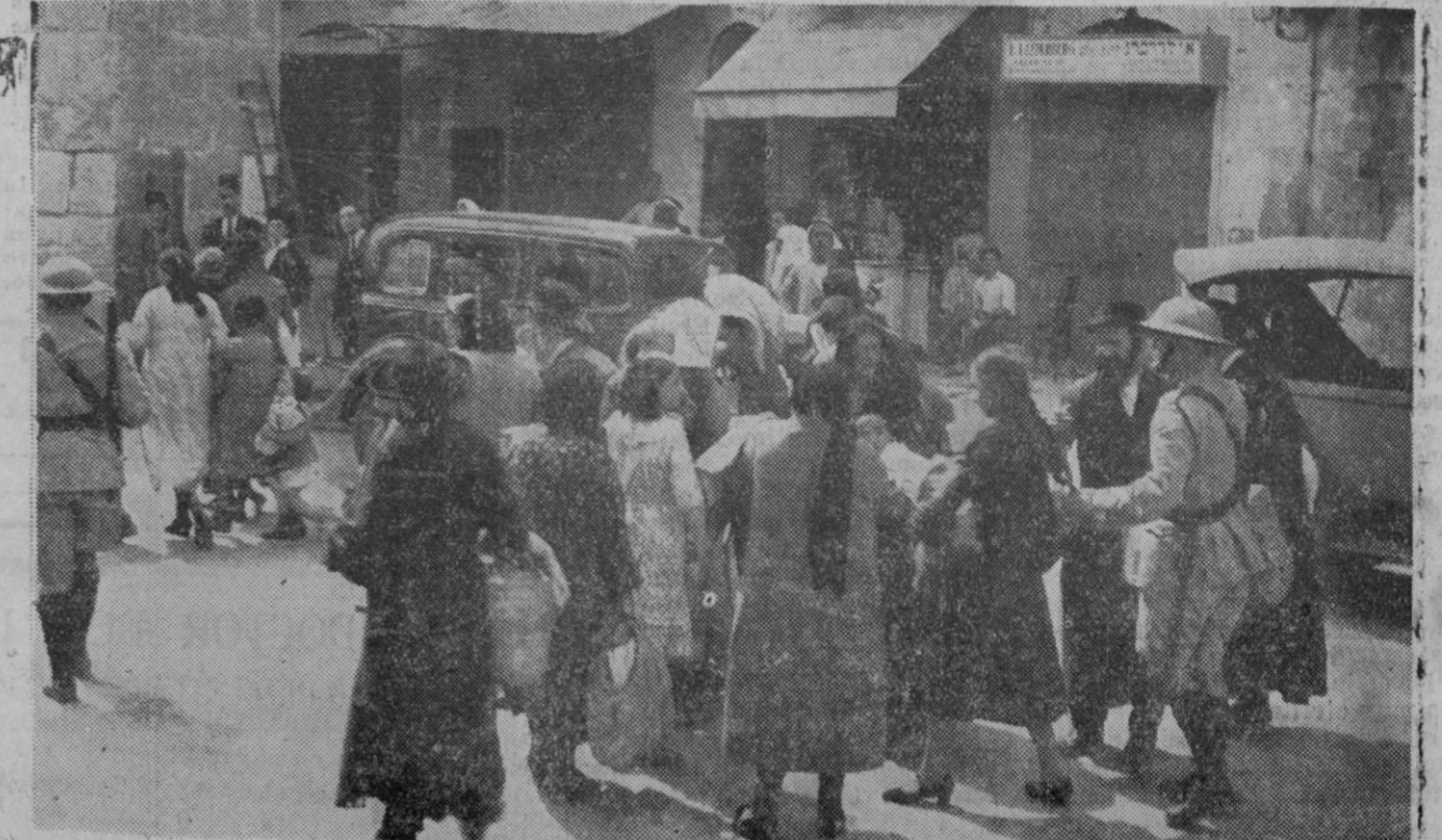
Los días agitados de la Palestina de hoy por el levantamiento de los árabes.

Pero este sentido del recuerdo fué nada más que aurora que pronto se cubrió de nubes. Desapariciones de cosas de gran interés, sobre todo en los últimos años, se han sucedido con una lamentable frecuencia. No solo por la incuria del Estado se han dejado deruir monasterios notables, como el de Arlanza, que fué cuna de un sentimiento castellano, que sintió con la más íntima delicadeza y al mismo tiempo con una indomable fuerza el Conde Fernán González, cu