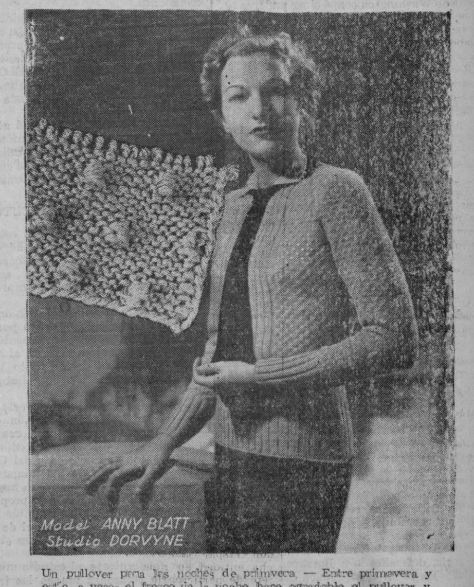
Model ANNY BLATT Studio DORVYNE Un pullover para las noches de primavera — Entre primavera y estío, a veces el fresco de la noche hace agradable el pullover y más aún si éste es de punto ancho, que pesa sobre el cuerpo. El delantero se hace como un chaleco y el dibujo del punto se logra, con el punto de tres mallas a la vez, en derecha, izquierda y de recha. Como las tres mallas en los puntos se hacen en la misma aguja, se logra el efecto del dibujo moteado. (Cliché Mediterráneo).