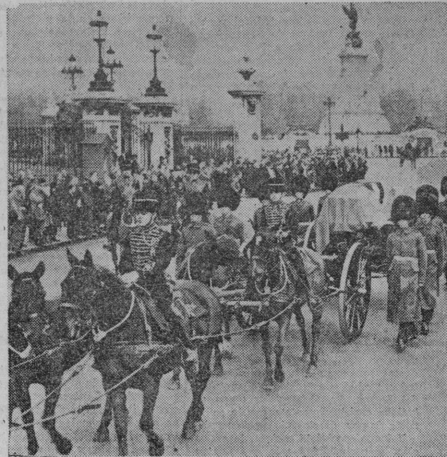
Los restos del Embajador de Alemania en Londres, Von Hoesch, al ser trasladados a Dover, para ser llevados a Alemania.