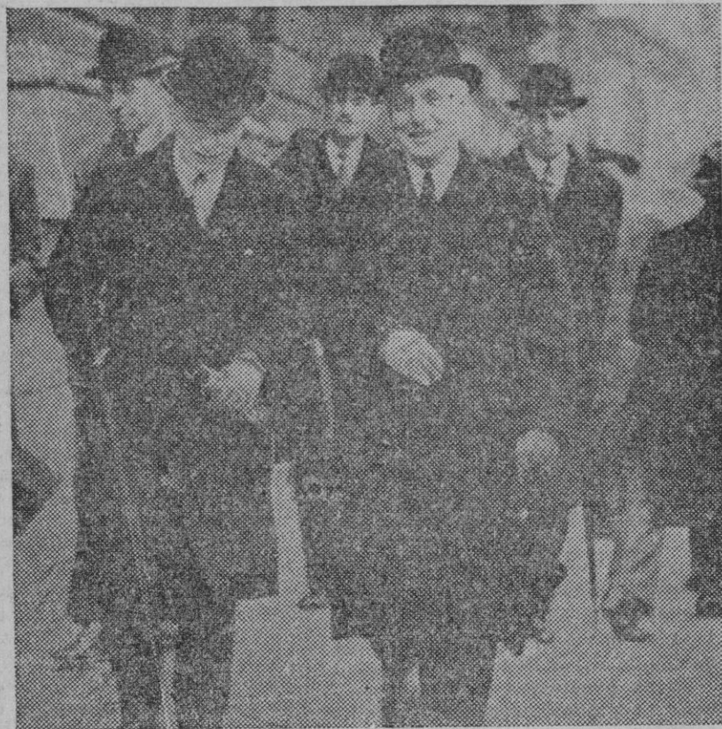
Los jefes de los Estados Mayores de Inglaterra, Francia y Bélgica, después de la reunión que han celebrado en Londres.

Si se lograra que se mantuviera el actual servicio, y a la vez se estableciera el que el próximo lunes comenzará a prestarse con Barcelona, entonces tendríamos que congratularnos de ello ya que veríamos aumentadas nuestras comunicaciones y las veríamos aumentadas con una capital que como Barcelona, por su intensa relación con Mallorca, requiere el mayor número de servicios para atender a las necesidades de esa relación.