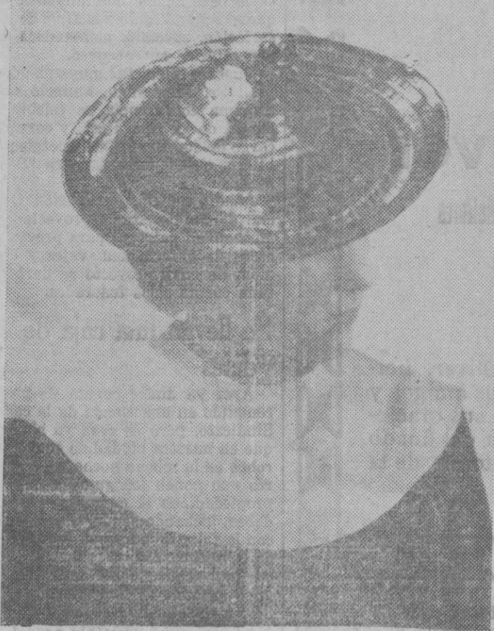
BONITO MODELO DE SOMBRERO PRIMUMVERAL. Bonito sombrero llamado "Pous e-Pousse", en paja de seda negra, con limones amarillos y rojos sobre el casquete.

7 MILLONES Y MEDIO BILLETE MIL PTAS. 11 MAYO LOTERIA NUM 1. PLAZA CORT