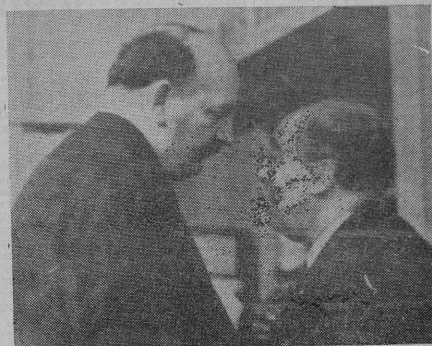
Los Sres. Flandin y Vasconcellos en Ginebra, cambiando impresiones acerca de la propuesta de paz que se formulará para poner fin al conflicto italo-etiope.

¿Persiste en España aun ese sentimiento? Indudablemente. En todos los momentos de la vida nacional es esperada la aparición de un hombre de genio, de una especie de héroe carlyano, o de un grupo o generación de reformadores. La nota común que conserva es la esperanza en el cambio brusco, repentino, radical, en una especie de conversión colectiva o la nueva vida. Cualquiera variación mas o menos aparatosa, reproducción acaso de achaques ya seculares, fomenta la llama mortecina de estas esperanzas, que hasta en adversas circunstancias, cuando mas nos alejamos de