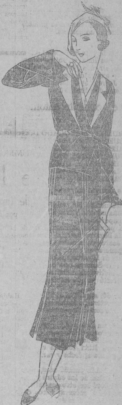
Traje azul marino. La chaqueta, iniciada en pelerina y los motivos recortados e incrustados en te a blanco. Talle ajustado. El cuello, de guayaco blanco, anudado. Falta alargada por un grupo de plisados delanteros.