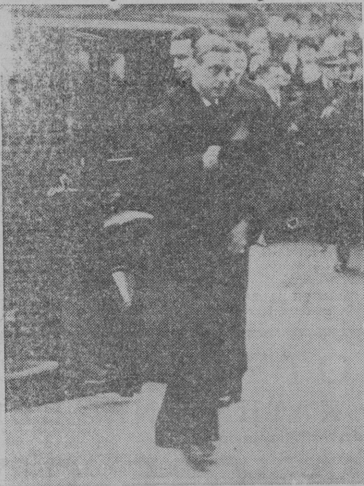
El Rey Eduardo VIII de Inglaterra, a su llegada a Broadcasting House, desde donde habló por radio a todo el Imperio.

Si el acuerdo fuera de gestionar la realización de aquellas obras que solo precisan la autorización del Gobierno para acometerse, y lograra el Sr. Gobernador con su relación con el poder público que fueran atendidas aquellas necesidades que hace tantos años venimos exponiendo, se haría acreedor a la más viva gratitud de esta capital.