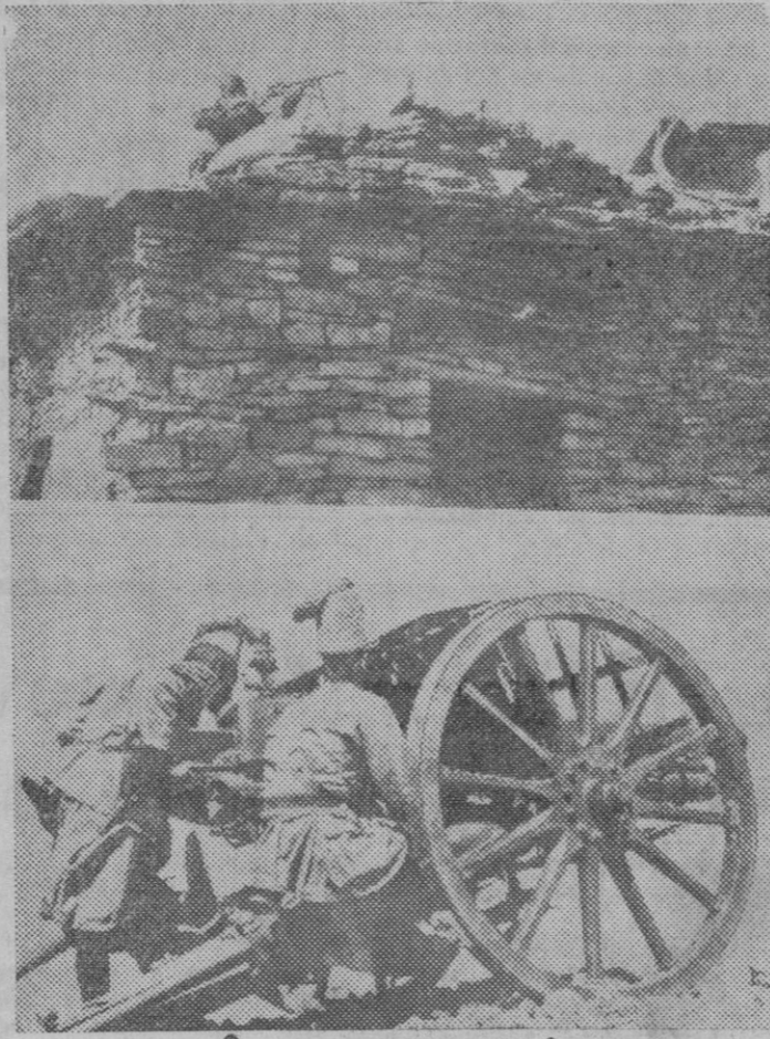
Arriba: soldados abisinios defendiendo una posición. Abajo: artilleros indígenas italianos atacando a los abisinios.