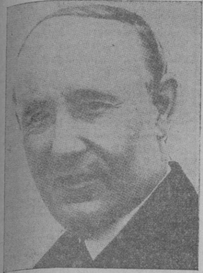
Bartolomé Pérez Casas Maestro Director de la Orquesta Filarmónica de Madrid, que hoy se presenta en el Lírico

Esta mañana han llegado procedentes de Barcelona los señores profesores que forman la Orquesta Filarmónica de Madrid, que como saben los lectores ha de dar tres conciertos en el Teatro Lírico.