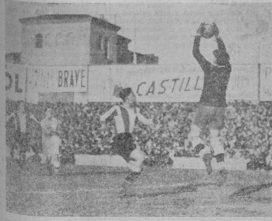
En Chamartín de la Rosa, lucharon el Madrid y el Hércules de Alicante, ganando los madrileños por 5 a 1.