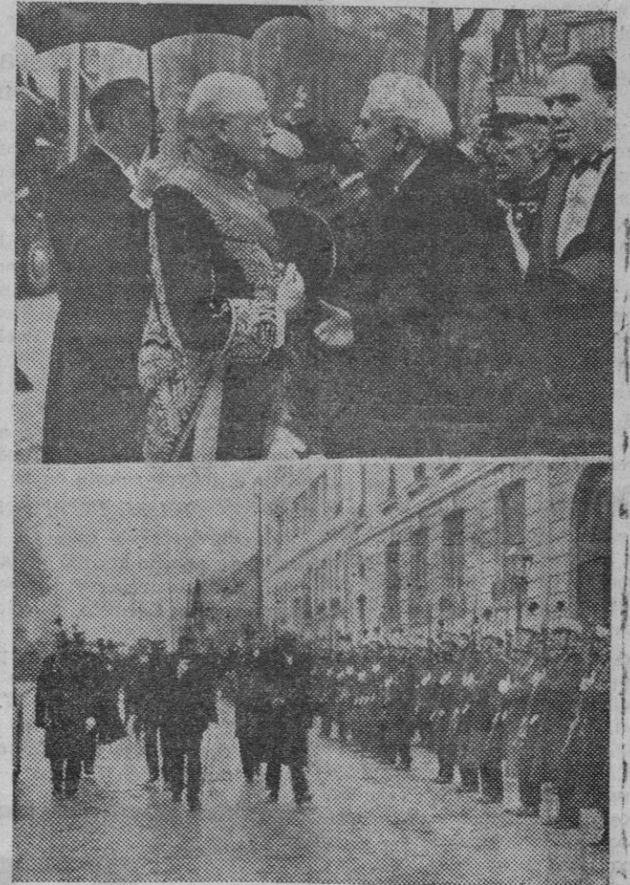
Los funerales celebrados en Madrid por el fallecimiento del Rey Jorge V de Inglaterra.

Pero no se destruye solo; han sido emprendidos numerosos trabajos en todas partes: profundización de galerías subterráneas para evitar el ataseo de las principales puertas de París, prolongación en las afueras de las líneas más utilizadas del Metropolitano.