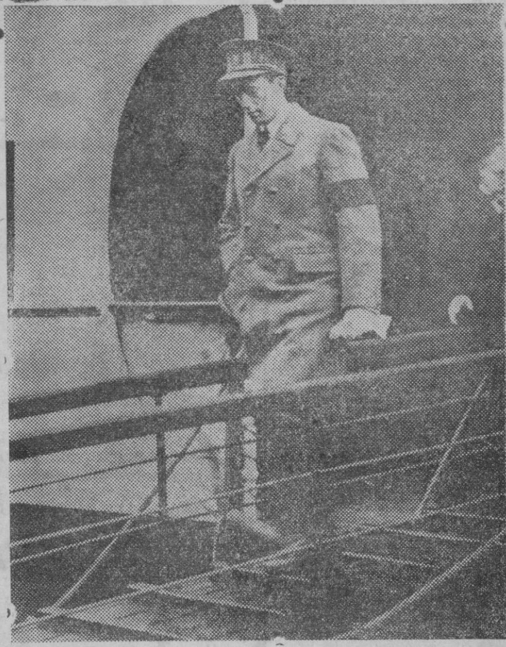
El Rey Leopoldo III a su llegada a Inglaterra para asistir al entierro de Jorge V.