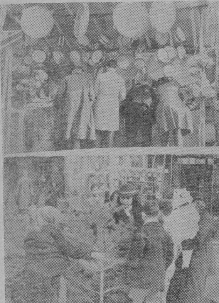
Vistas de puestos instalados en Madrid para la venta de árboles de Navidad, panderetas y zambombas, con motivo de las presentes fiestas.

Con esas dos leyes fundamentales, indispensables, se pedía a las Cortes la dispensación de otras varias que no permitían esperar. Había todo un plan económico que se reputaba urgente. Tampoco habrá ya plan económico. Ni presupuesto, ni leyes fiscales. Se dirá: Es que, precisamente, por la hostilidad de las Cortes para esas leyes, ha llegado la crisis, y con ella, la disolución de la Cámara. Esa razón es fácilmente atacable. No. No se hostilizaba un plan económico. Se combatían extremos concretos de ese plan. Se pedía una rectificación en la parte injusta de las restricciones que habían llevado lesión innecesaria a millares de modestos hogares. Se pedía la modificación de tipos y de perfiles en la ley de Derechos reales. Se habían aprobado, sin dificultad, otras leyes del plan, como la de Timbre, la de Utilidades, la de Conversiones de Deuda. Todo se reducía a retoques, a modificaciones. La crisis ha llegado con un proceso lento y público. En cada Consejo se le decía al Sr. Chapaprieta: "Si da Ud. a su programa financiero un ritmo mas adecuado a la realidad presente, si no se muestra usted intransigente, se le aprobarán sus proyectos". Y el mismo Ministro de Hacienda reconocía que los que éso le pedían, llevaban razón. Su única resistencia estaba