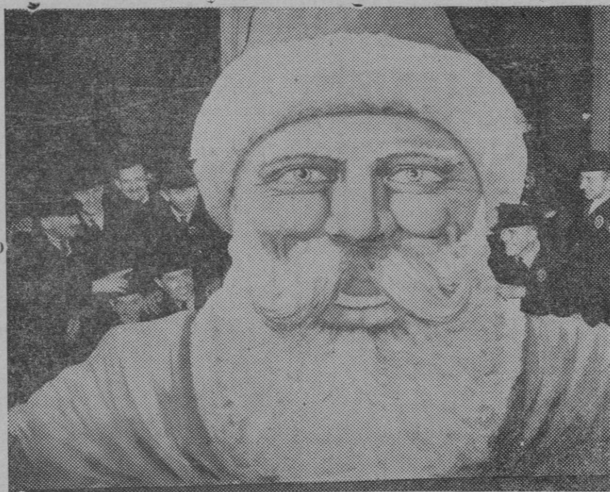
Gigantesco Padre Noel, construído por los empleados de los ferrocarriles ingleses de la Great Western Railway, con motivo de celebrar el centenario de la constitución de la empresa.

No sería justo que asistiéramos impasibles por no decir indiferentes a una obra tan admirable y que tantos beneficios reporta a las familias modestas de aquella populosa barriada; antes al contrario, ese esfuerzo ha de ser mirado con atención, y ha de ser alentado por todos con aplausos y con apoyos efectivos, a fin de que una tan admirable empresa pueda mantenerse, sino desarrollarse cada vez con mayor pujanza, para que no se dé el caso, que fuera harto lamentable, que por faltar las asistencias debidas a semejantes obras, pudieran un día agotarse en ella la voluntad de quienes tan admirablemente la dirigen y la secundan.