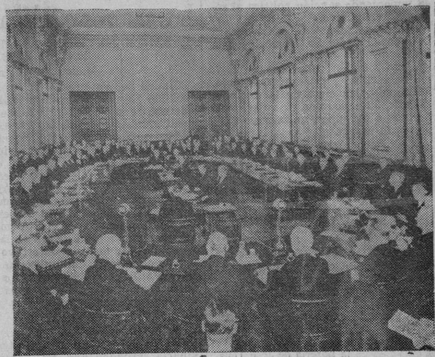
Acto de apertura de la conferencia naval que se celebra actualmente en Londres.

Es ejemplar el conocimiento de lo que esas quince unidades de aumento presentan en el conjunto de nuestra economía y detalladamente en su fase industrial. Para alcanzarlo no tenemos que hacer más que un breve espiguelo en los cuadros de la estadística oficial y comparar cifras. Prescindiendo de las industrias más poderosas, como la textil, cuyo progreso, a pesar de sus máculas de organización y ordenación financiera, es verdaderamente extraordinario, como las hulleras y siderúrgicas, entonces en auge natural, estudiamos a través de ese modesto quince por ciento de aumento el progreso de las industrias menores. El resultado es el siguiente: desde 1914 a 1916 la exportación de productos de alfarería aumentó de 105 toneladas a 441; la de loza, de 48 toneladas a 82; la de vidrio y cristal, de 10 a 14; la de cemento—una de nuestras industrias contadas de sobreproducción—, de 7.000 a 16.000; la de material de tracción, que era nula, se elevó a 9.000 toneladas; la de motores, de 58 kilos a 300 toneladas; la de aparatos telefónicos, de 17 a 75; la de cortidos, de 500 a 5.000; la de calzado, de 514 a 3.000; la de botones, de 34 a 70; la de juguetes, de 60 a 229; la de