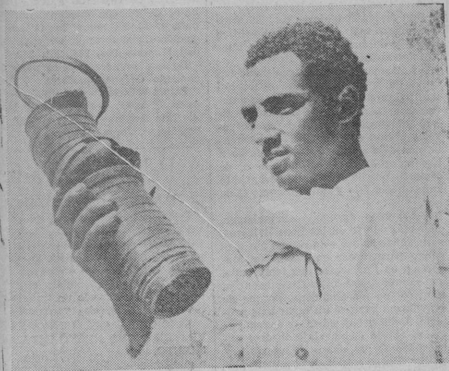
Una de las bombas arrojadas por la aviación italiana al bombardear Dessie.