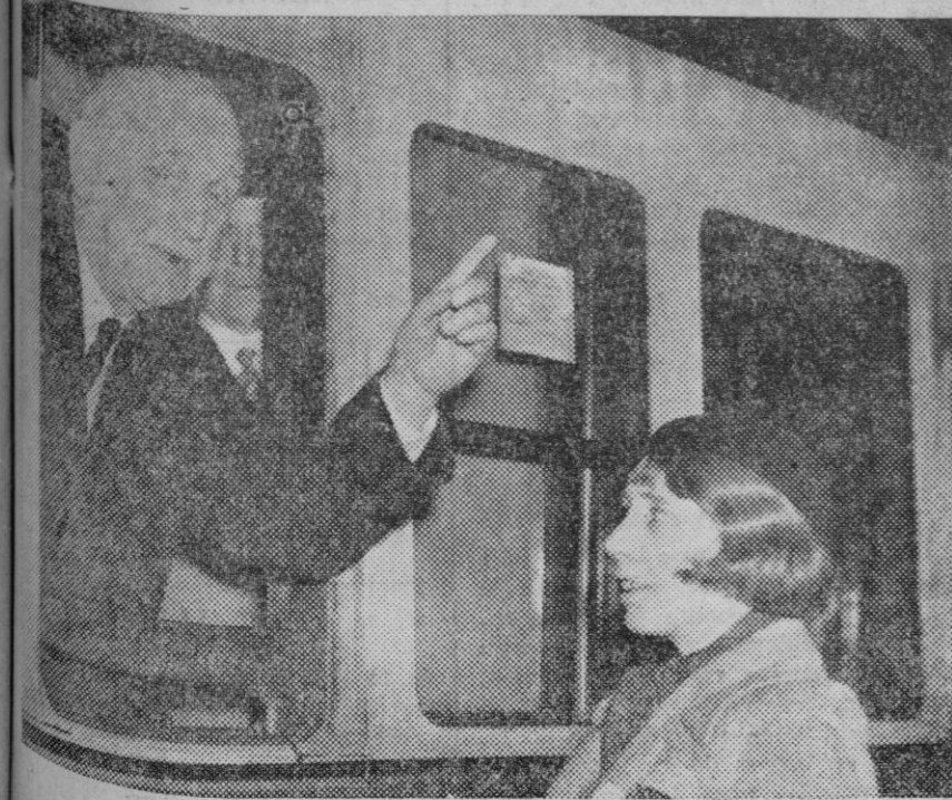
Sr. Lansbury, destacado miembro del partido laborista inglés, saliendo de Londres en viaje de propaganda electoral.