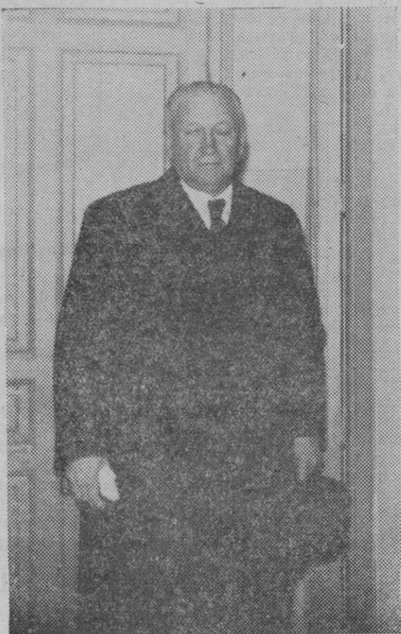
El exministro de Trabajo Don Francisco Largo Caballero, que después de los días que ha estado en prisión atenuada con motivo del fallecimiento de su esposa, ha vuelto a ser llevado a la Cárcel Modelo.

Precedente es el acuerdo y de esperar es que esas gestiones se realizarán con actividad para que dichas dependencias puedan ser utilizadas y no queden sin provecho los alquileres que por las mismas se vienen satisfaciendo.