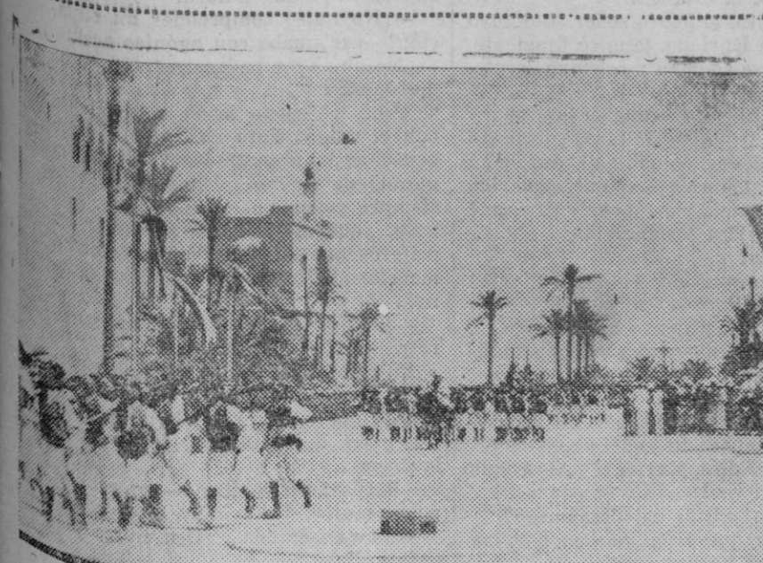
El Gobernador General de Libia, Mariscal Balbo, pasa revista a las tropas indígenas de aquella región.