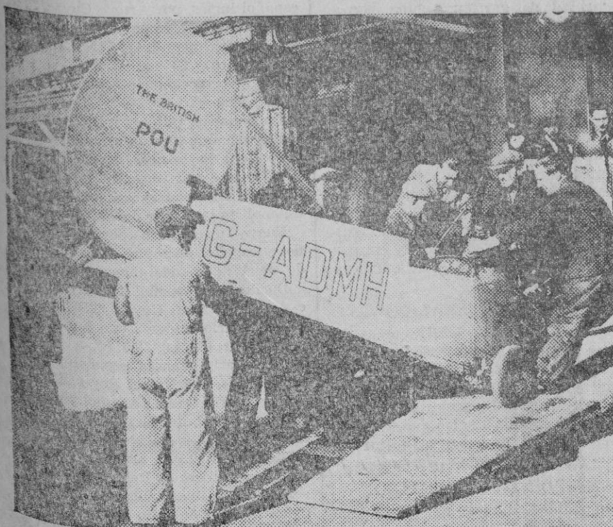
El famoso avión «pulga volant» con un motor de 10 H. P., que figurará en la Exposición de Aeronáutica de Londres.