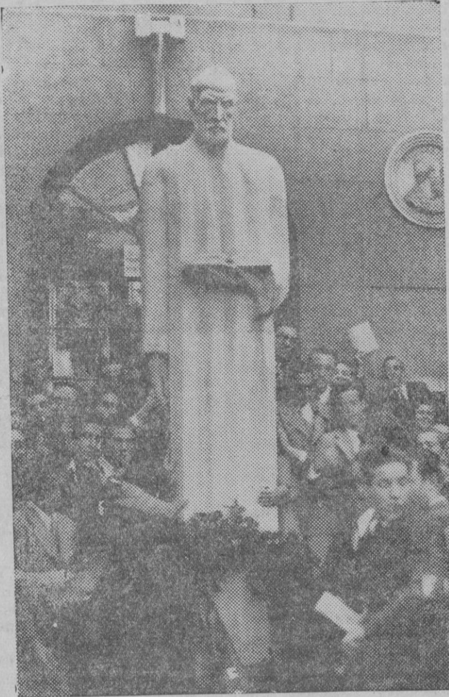
Con motivo de cumplirse el primer aniversario del fallecimiento de Ramón y Cajal, los alumnos de la Facultad de Medicina de Madrid, depositaron una corona de flores en el monumento erigido al sabio histólogo en el patio de San Carlos.

La finalidad de la Fiesta de Homenaje a la Vejez del Marino, es digna de todo apoyo y de toda simpatía.