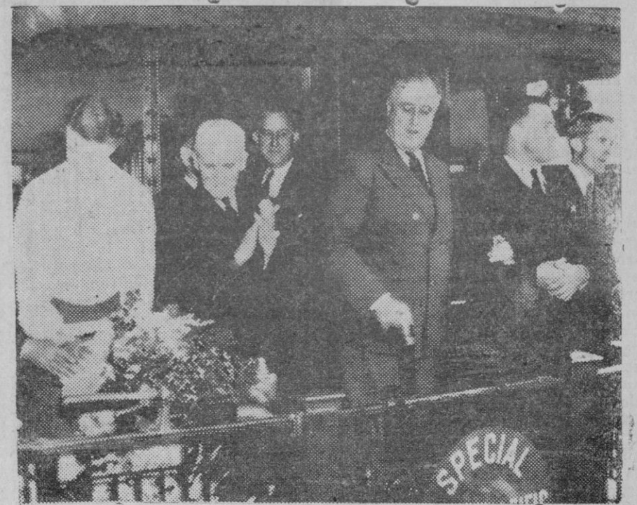
El Presidente de los EE. UU. Sr. Roosevelt, en la plataforma del tren especial que le condujo a la Costa del Pacífico, al despedirse de la multitud que acudió a la Estación.

Para el público del "gallinero" lo interesante es siempre la música y los divos. Hay señor que se lee durante la representación toda la par-