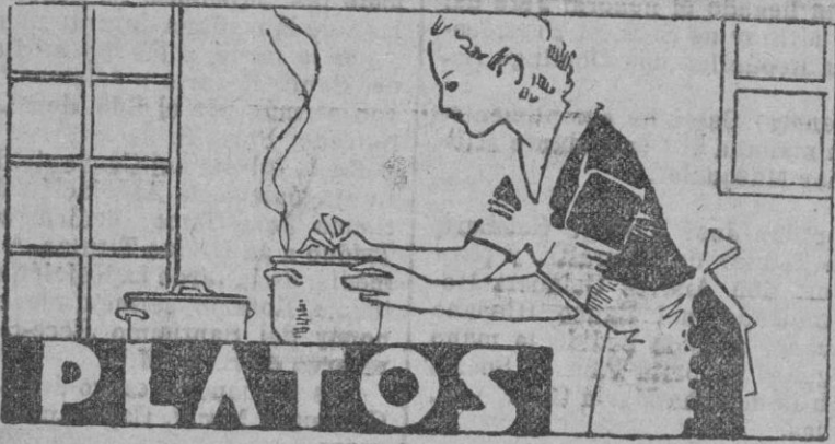
El jamón crudo con higos verdes, es una cena muy ligera.

Las gentes empiezan a sentir ciertas preocupaciones por su salud. Sabidamente conocido el sistema adoptado fuera de nuestras fronteras de hacer una cena frugal, muy ligera, aquí miramos las ventajas de tal forma nueva.