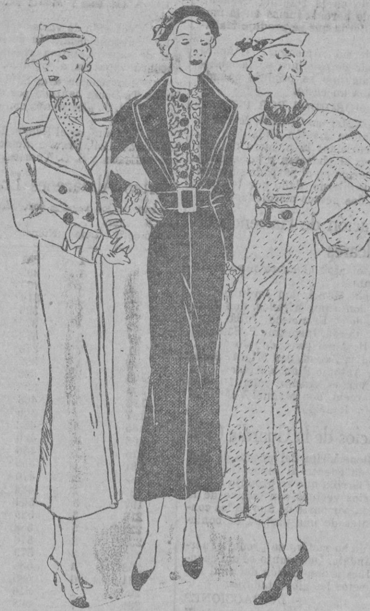
Los ingleses dan preferencia al abrigo de forma nueva.

Mientras los franceses se encastellan en dar gran resonancia y extensión a la salida de la capa, presentando tentadores modelos a la satisfacción femenina, los ingleses afirman su criterio de conceder toda su simpatía al abrigo, introduciendo orientaciones más avenidas con la exaltación de la silueta.