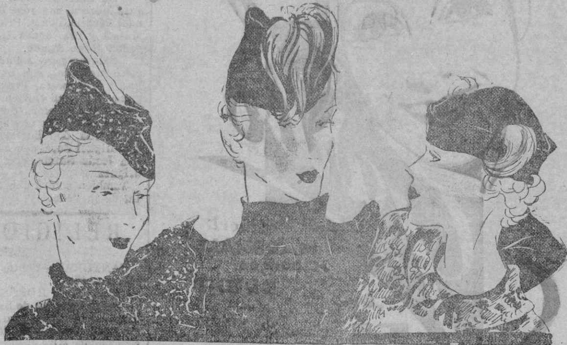
Un sentido de sugestiva fantasía, resurgen la modelación de sombreros.

Las plumas se insertan nuevamente en la moda de los sombreros como si su recuerdo atrajera la idea de in-