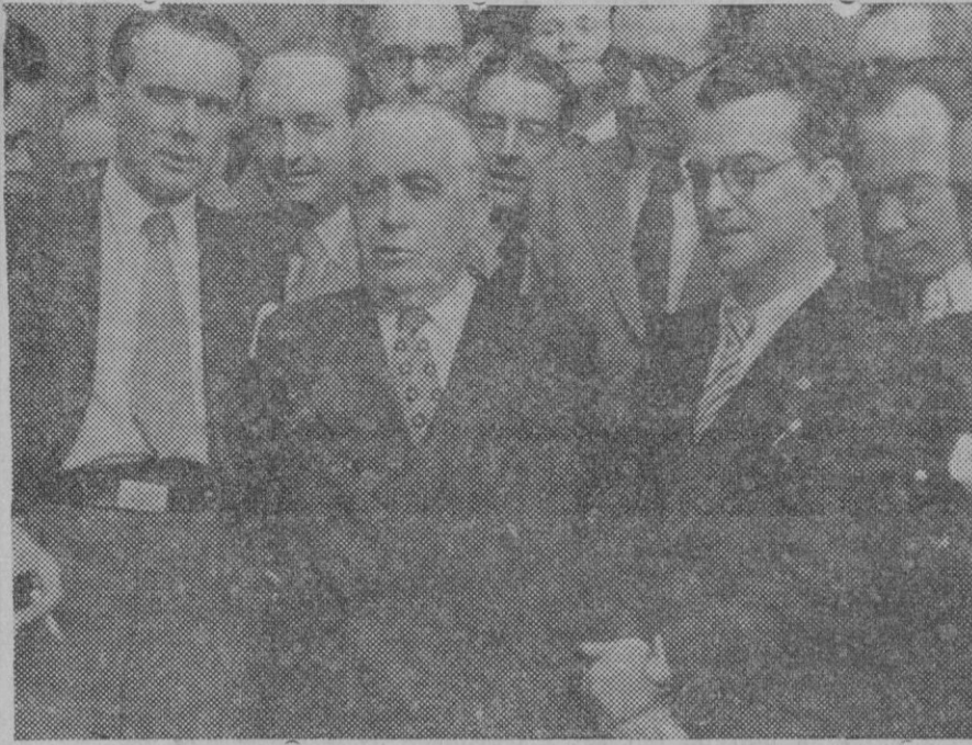
El Presidente del nuevo Consejo de Ministros Don Joaquín Chapaprieta, al salir de Palacio después de presentar a S. E. la lista del nuevo Gobierno.