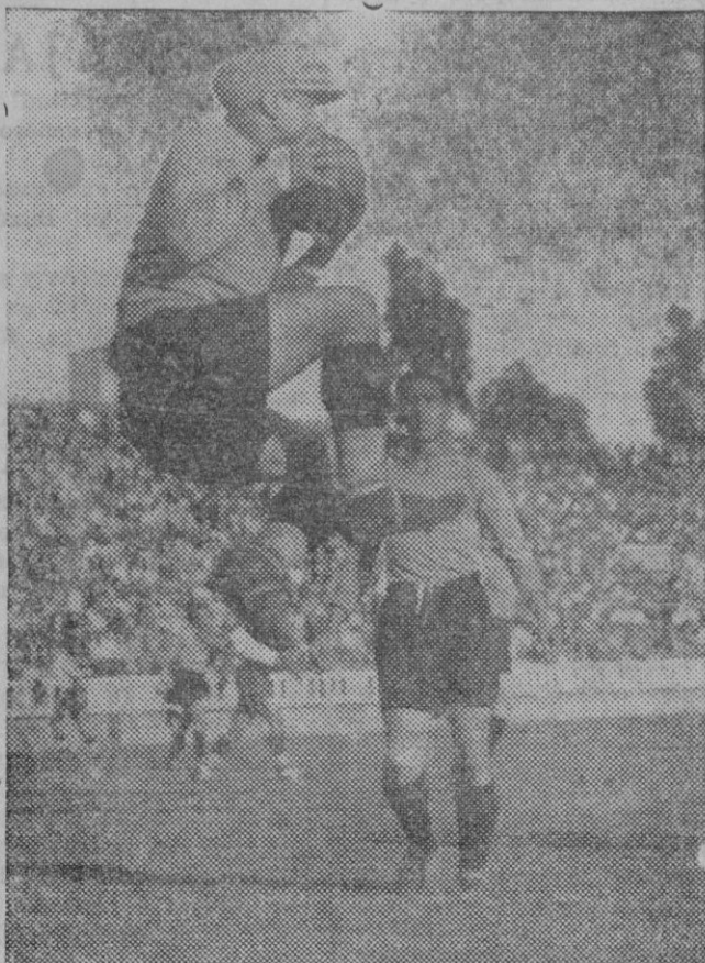
Un numeroso público acudió el martes, Festividad de la Merced, al campo de Las Cortes de Barcelona, para presenciar el partido de fútbol entre los equipos Barcelona y Selecciones de Sevilla. El resultado del partido fué de 2 a 0 a favor del Barcelona. Una jugada en la puerta del Barcelona.