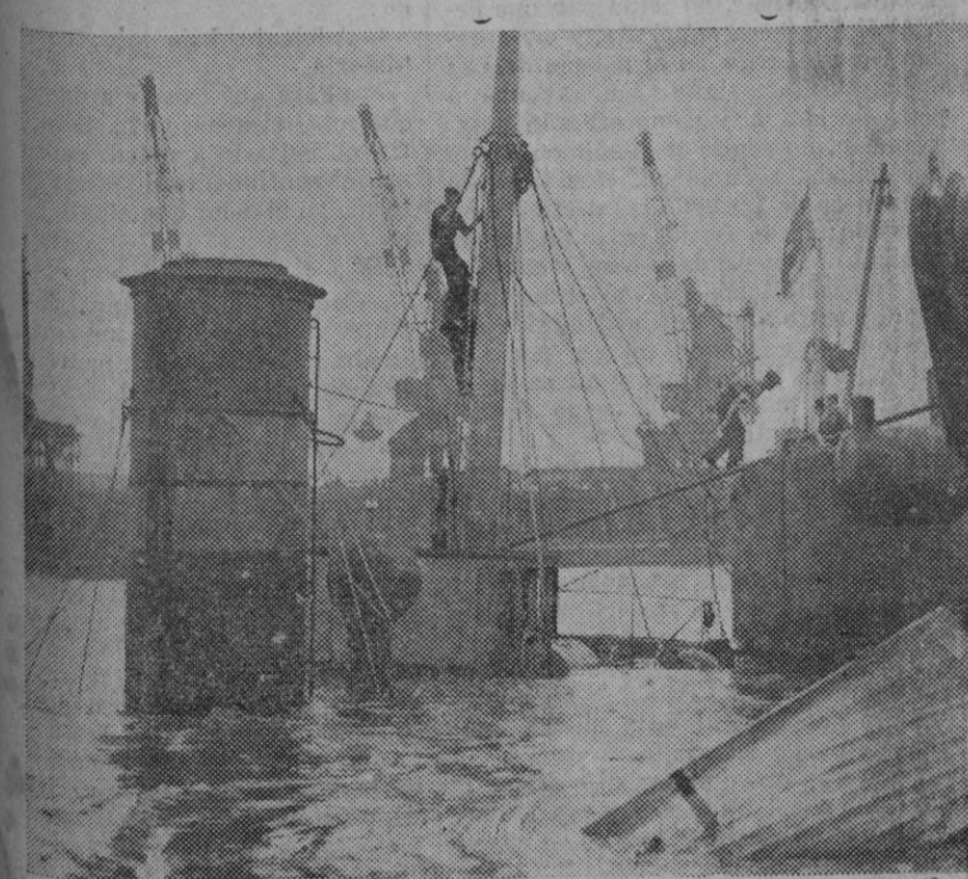
Al salir del puerto de Londres el barco inglés «Cragside», de 450 toneladas, botado al agua hacía tres semanas, chocó con el vapor «Madruga». El «Cragside» se hundió en el Támesis en el espacio de 50 segundos. Su tripulación fué salvada.

En medio de esas posiciones extremas hay unos partidos que gobiernan y que tienen como norma de actuación el respeto a la legalidad. Esos partidos propugnan una reforma constitucional porque en fealdad que limando los preceptos extremistas del Código fundamental se puede hallar la solución intermedia. Si se tratara de hacer una