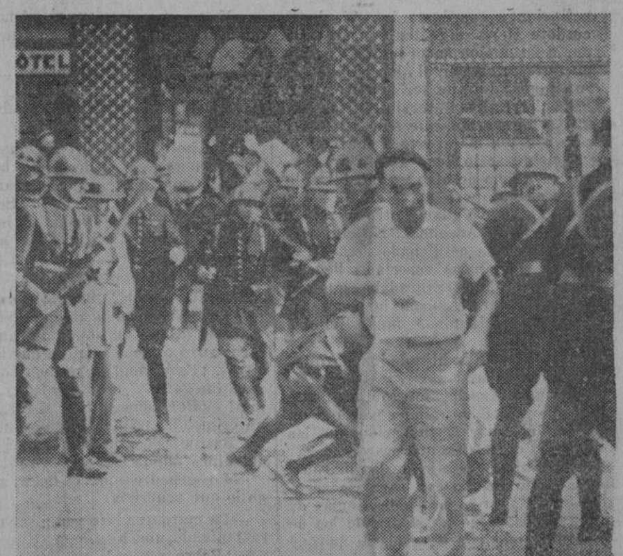
A raíz de la rebaja del 10 por 100 sobre los jornales de los obreros de los Astilleros navales decretado por el Presidente Laval, en Toulón se registraron graves incidentes, teniendo que acudir la artillería para apagar a las tropas. (Telefoto de Toulón vía París.) (Express-Foto)