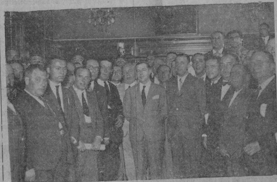
Comisión de alcaldes de España, que han llegado a Madrid, en su visita al ministro del trabajo para protestar de la ley de coordinación.