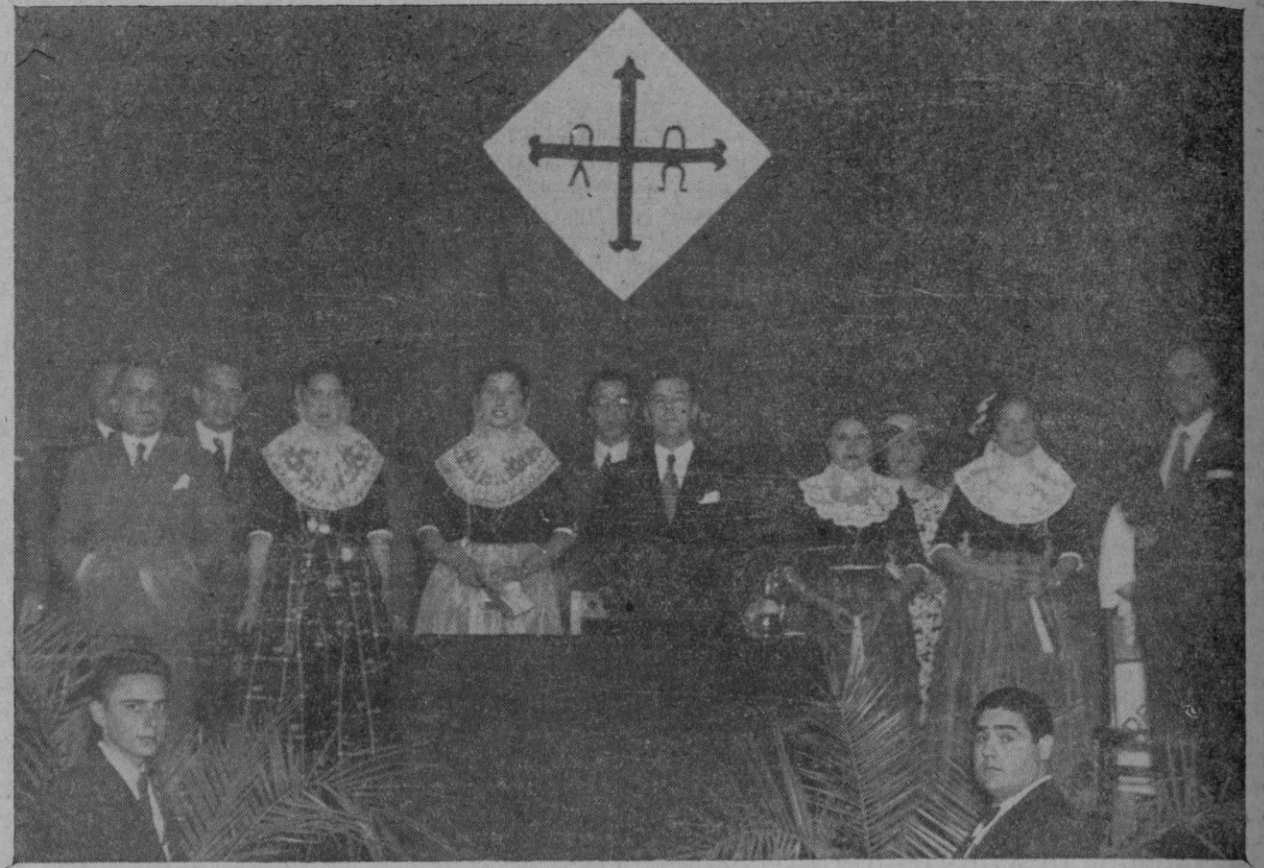
El Sr. Ministro del Trabajo, rodeado por distinguidas señoras de Lluchmayor, ataviadas como nuestras payesas típicas, en el escenario del Teatro Balear momentos antes de comenzar el acto político celebrado ayer.

El Excmo. Sr. ministro del Trabajo fué cumplimentado ayer en el Hotel Victoria por la Asociación Provincial Balear de Secretarios de Juzgado Municipal, representada por los Secretarios de Sóller, Andraitx, Marratxí, Consell, Puigpuent y otros.