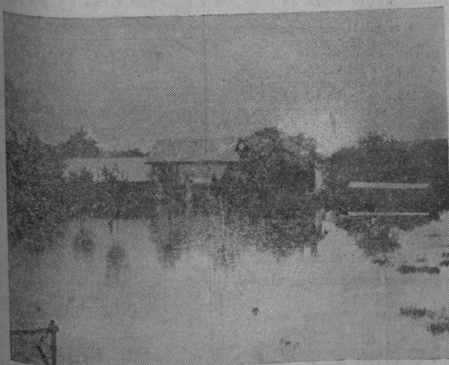
A consecuencia de la fuerte crecida del río Rhone motivada por las fuertes lluvias recientes, se ha desbordado en Suiza en los pueblos del Valais, inundando grandes cantidades de terrenos. Una granja del Valais bajo el agua.