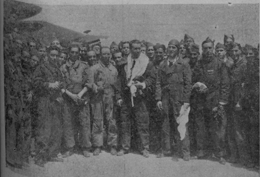
El capitán Manso de Zúñiga, acompañado de los pilotos de su escuadrilla, los cuales resultaron vencedores de esta etapa de la IV Vuelta a España. La única escuadrilla que llegó completa fué la de el capitán Manso de Zúñiga.