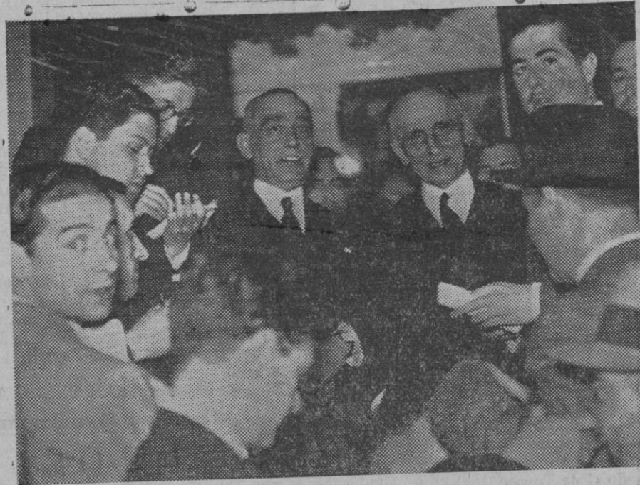
El Sr. Martínez de Velasco visitando a Don Merquíades Alvarez cuando el primero hizo gestiones para constituir Gobierno.

Celebramos que en el nuevo Gobierno que se ha constituido continúe en la cartera de Comunicaciones Don César Jalón, quien conocedor de esa necesidad, y por su deseo manifestado reiteradamente de servir los intereses de la capital, acogerá, sin duda, favorablemente las peticiones que le han sido elevadas.