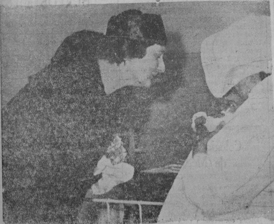
La reina de los belgas ha visitado en estos días los principales hospitales de Bruselas. Mucho de su tiempo está dedicado a obras de beneficencia.