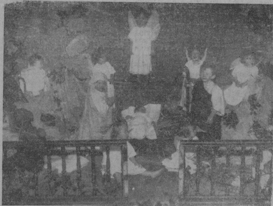
UN «BELEN» VIVIENTE EN UNA ESCUELA PARISIEN. En la escuela maternal dirigida por las hermanas de San Vicente de Paula, ha llamado la atención estos días un encarnador «belén» viviente realizado por niños. Un a vista del belén viviente.

La importancia del proyecto aprobado, y el impulso vigoroso que su realización dará a la organización de la enseñanza primaria en el progresivo pueblo de Lluçmajor, es motivo de satisfacción vivísima para aquel vecindario—al que nos es grato felicitar por ello— y para cuantos deseamos que la instrucción, como base esencial que es de la cultura patria y base de su prosperidad, sea objeto de la preocupación constante y preferente de los que rijan los destinos de nuestra nación.