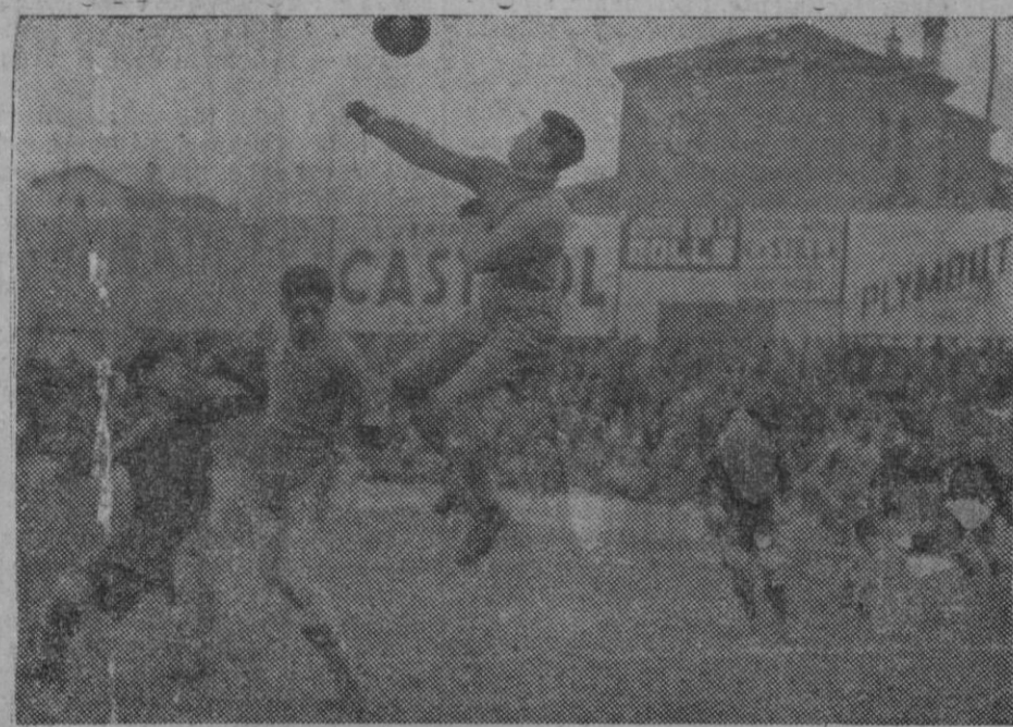
LA SELECCION ESPAÑOLA DE FUTBOL, JUEGA UN PARTIDO CONTRA EL BOCKGAY. — El defensa húngaro en un despeje durante el partido celebrado en Madrid entre el equipo húngaro Bockgay y la selección española que en breve tiene que actuar contra Francia.

Este es el buen camino. Sólo persiste un error común al conservador, al socialista y al comunista americanos. El de creer que el restablecimiento económico no puede alcanzarse más que por medio de altos salarios, con la correspondiente elevación de precios, para asegurar un alto «standart» de vida. Mi desacuerdo en absoluto. La industria no puede pagar caro el trabajo y vender el producto barato, y si lo vende caro el salario alto es un engaño. Lo que se gana en mayor cantidad de moneda se pierde en altas rentas, alimentos y vestidos caros. El salario real se mide por lo que se puede adquirir con él. Hace algunos años John Stuart Mil denunció como ilusión popular la idea de que los altos precios hacen salarios, pero la gente no se cura de ilusiones. Bien venido sea el salario bajo con tal de que la vida sea barata. Dentro de esta relación se puede igualmente alcanzar el más alto «standart» de vida, inclusive radio y automóvil, siempre que el León capitalista se conforme en reducir su parte en los provechos. El Japón ofrece al mundo sobre este sistema un instructivo ejemplo. Y a los que hablan del bajo «standart» de vida y del trabajo de esclavos en el Japón, hay que responderles que pregunten al pueblo japonés si se siente satisfecho y poderoso.