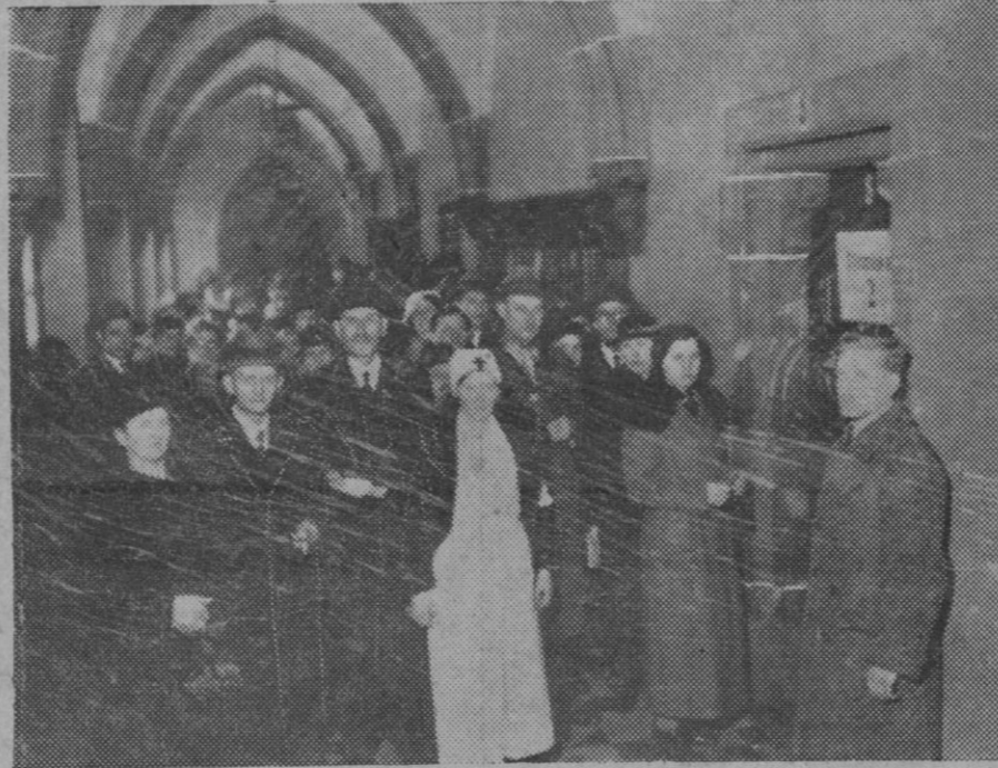
EL SARRE HA DICHO DE UNA MANERA DECISIVA, SU VOLUNTAD. — Los sarrenses, han dado una prueba de alto civismo durante la votación del plebiscito que se ha desarrollado con un orden perfecto. Aquí ve mos al público haciendo cola en el Ayuntamiento de Sarrebruck, esperando el momento de depositar su voto.

anterior, que no conseguimos apoyo casi, sirviendo de pretexto para ello el escaso número de obreros que estaban en paro forzoso, sin reparar que ello era consecuencia no de que aquí no exista el problema sino merced a los esfuerzos agotadores que venía haciendo la administración municipal.