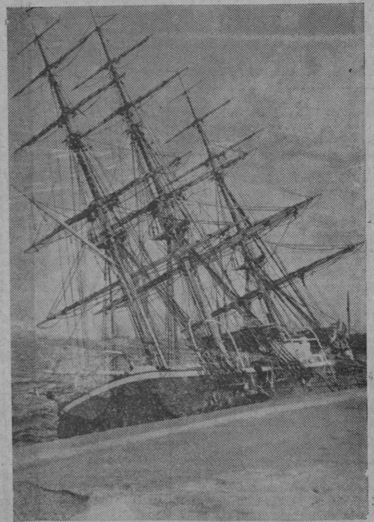
UN VELERO AMERICANO VIENE A ESTRELLARSE CONTRA UN MUELLE DE BROOKLYN.— Sorprendido por la tempestad, el tres mástiles americano «Joseph-Conrad», ha venido a estrellarse contra el muelle de Brooklyn, sufriendo importunas averías.