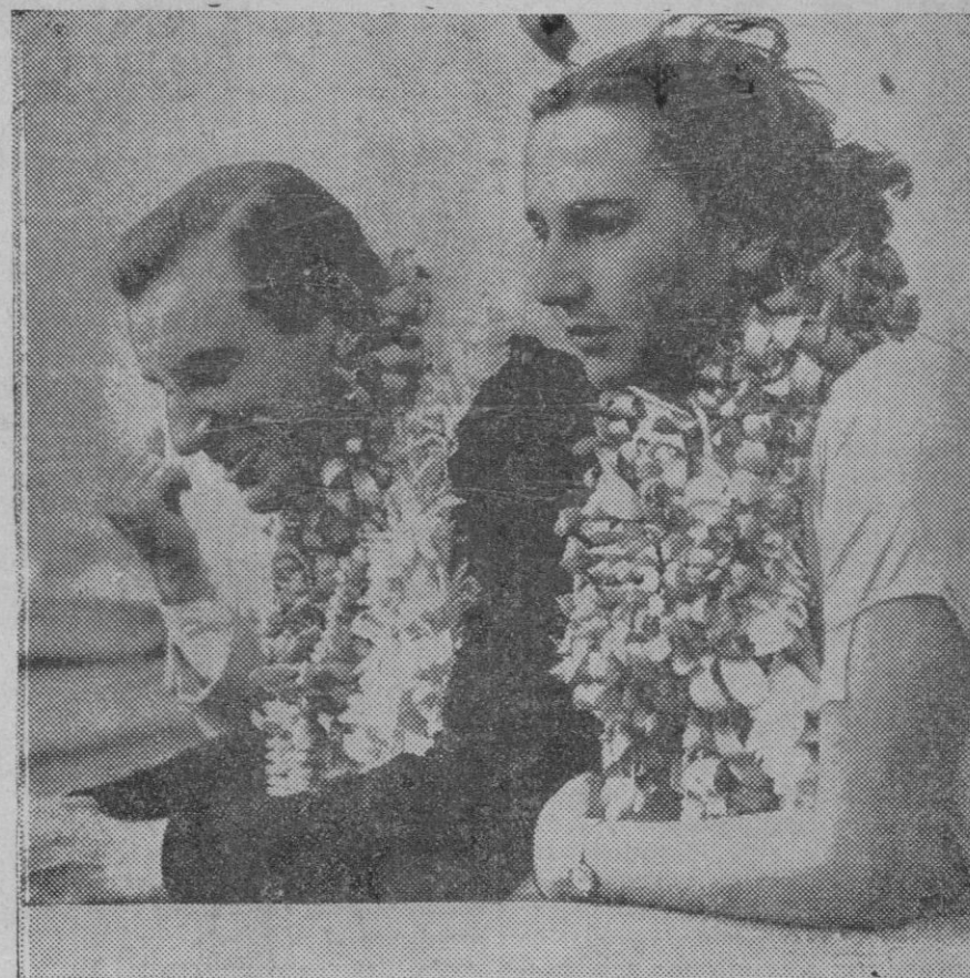
LOS CAMPEONES DEL MUNDO DE TENNIS SE DESPIDEN DE HONOLULU. — Fred Perry y Dorothy Round, campeones del mundo de lawn-tennis abandonando Honolulu para tomar parte en el Campeonato del Centenario de Melbourne. Ambos campeones, han estado viajando por Norte-América y Oceanía durante varios meses.