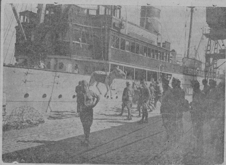
LAS FUERZAS DE LA LEGION EN BARCELONA.— Desembarque del ganado y material, de las fuerzas legionarias que el Gobierno de la República ha enviado a Barcelona.

Tercera fase, o fase actual: la rotación del Gobierno de la República y la de la Generalidad están casi de-