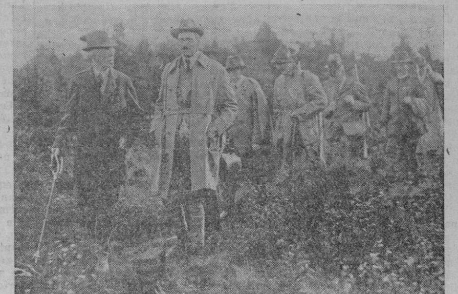
CACERIA REAL.— El Rey de Suecia y el rey Christian de Dinamarca, han asistido a una cacería de renos con que el primero ha obsequiado al segundo. El rey Gustavo de Suecia y el rey Christian de Dinamarca, fotografiados durante la cacería.

Parece oportuna la insistencia. ¿Qué importa al mundo cual haya sido realmente la cuna de Colón? Que naciera en Génova, en Cataluña o en