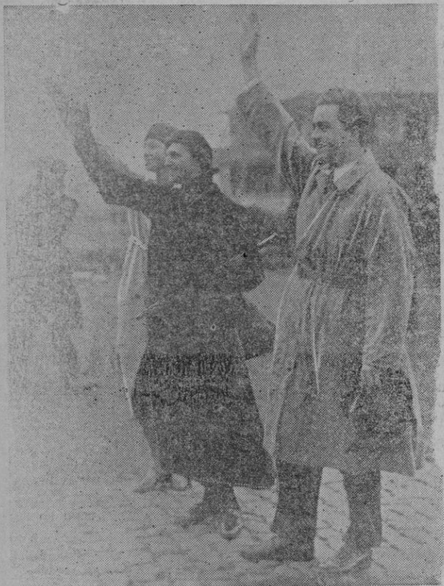
LA GRAN DUQUESA DE LUXEMBURGO PASA POR BRUSELAS. — A su paso por Bruselas con dirección a Londres, la gran Duquesa de Luxemburgo, ha sido saludada en el aerodromo de Evére, por la ex-Emperatriz Zita, el príncipe Othon y la princesa Josefina de Habsburgo.