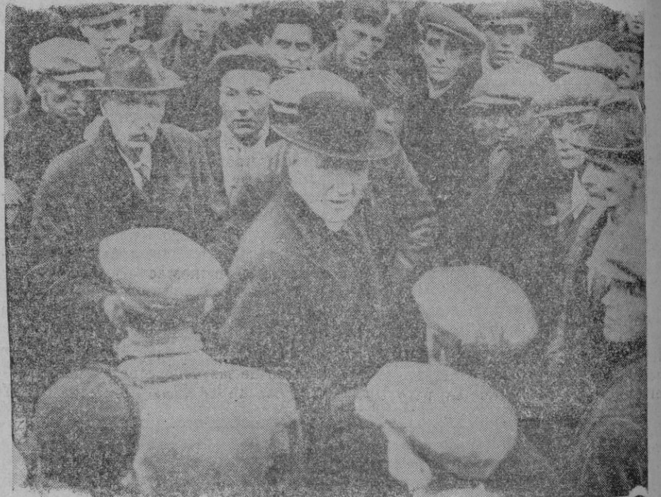
DE LA CATASTROFE MINERA DE INGLATERRA. — El reverendo Jones, Vicario de la parroquia de Gwersylit, reconfortando a las desesperadas familias de los mineros enterrados vivos en el pozo de la mina Gresford.