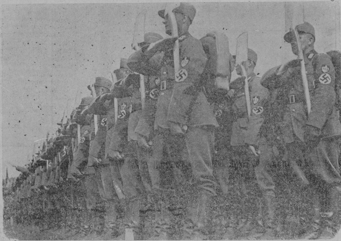
EL DIA DEL SERVICIO DE TRABAJO EN NUREMBERG. —52.000 hombres del servicio de trabajo, procedentes de todos los extremos de Alemania, se han reunido en el enorme campo de aterrizaje del Zeppelin, y en perfecta formación han rendido un homenaje al Führer. El saludo de los hombres del servicio de trabajo.