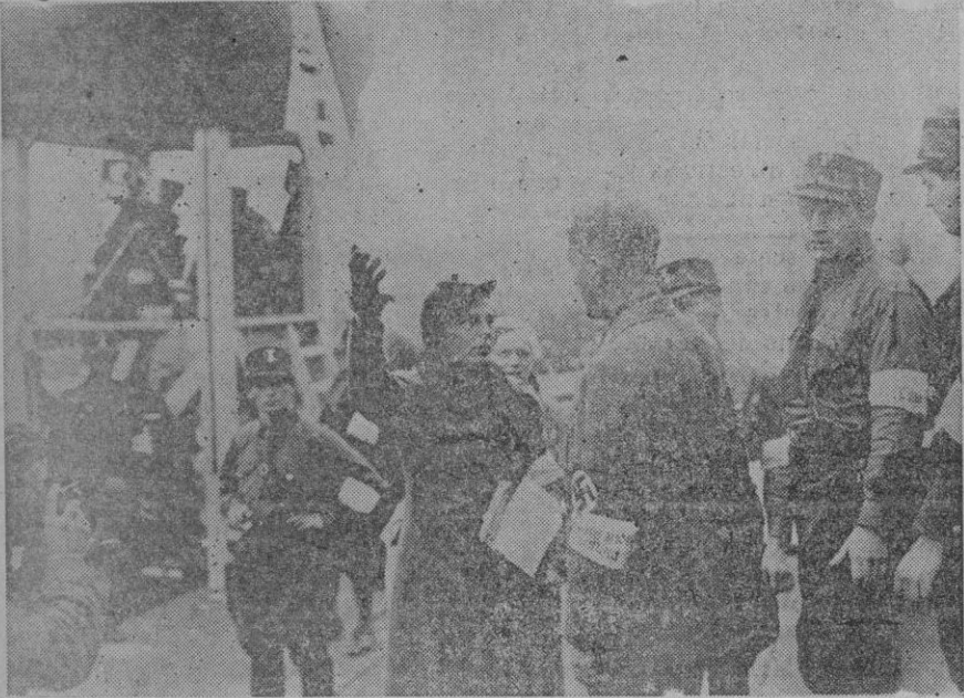
La conocida actriz alemana Lina Riepensthal, directora femenina de propaganda nazi, ha sido encargada por el gobierno del Reich para la propaganda femenina del nacionalsocialismo. Aquí la vemos dando órdenes durante el Congreso Nazi de Nuremberg.