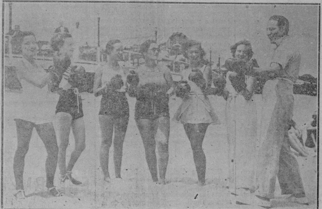
MAX BAER SE ENTRENA.—El gran boxeador Max Baer, campeón del mundo, y que encuentra con dificultad «sparring-partners» a causa de su «punch», ya tiene un equipo con quien entrenarse.