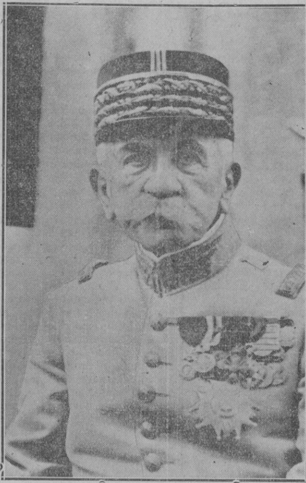
HA MUERTO EL MARISCAL LYAUTEY. — El general Lyautey. Una de las figuras más eminentes de la república francesa, ha fallecido en Vezelise (Meurthe y Moselle)

El ambiente favorable a nuestra pretensión, debe ser aprovechado, para ver de lograr una total satisfacción a las legítimas aspiraciones que venimos sosteniendo para que nuestras comunicaciones marítimas respondan a las necesidades de esta región.