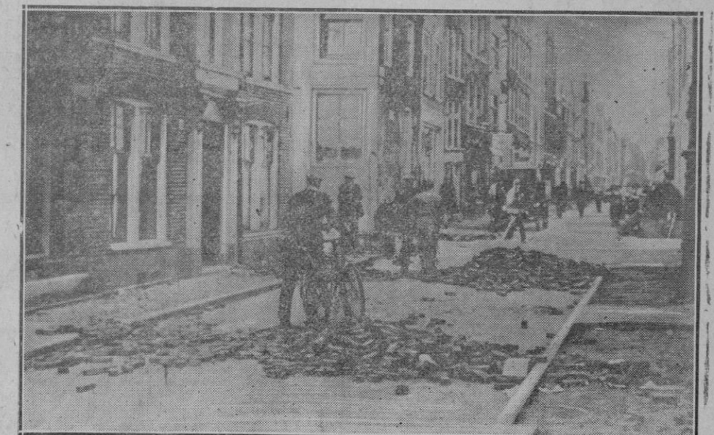
GRAVES SUCESOS EN AMSTERDAM. — A consecuencia de un choque entre comunistas sin trabajo y la policía ha habido en el barrio de Jordaan varios muertos y numerosos heridos. Aspecto de una de las calles después de los sucesos

Y extrayendo del arcón lateral de la cripta el álbum de los ilustres y raros autógrafos, me lo alargó, ordenando: