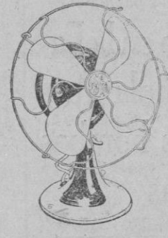
20 cm. fijo e inclinable Ptas. 45'50