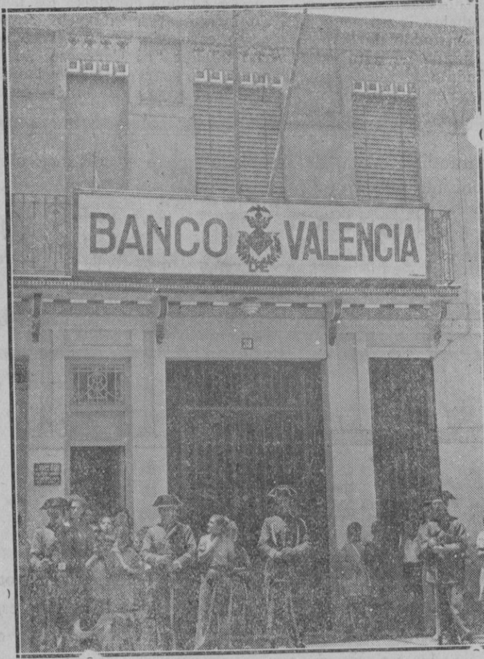
Edificio de la Sucursal del Banco de Valencia en Benetuser (Valencia) en el que se ha cometido un atraco de 40.000 pesetas