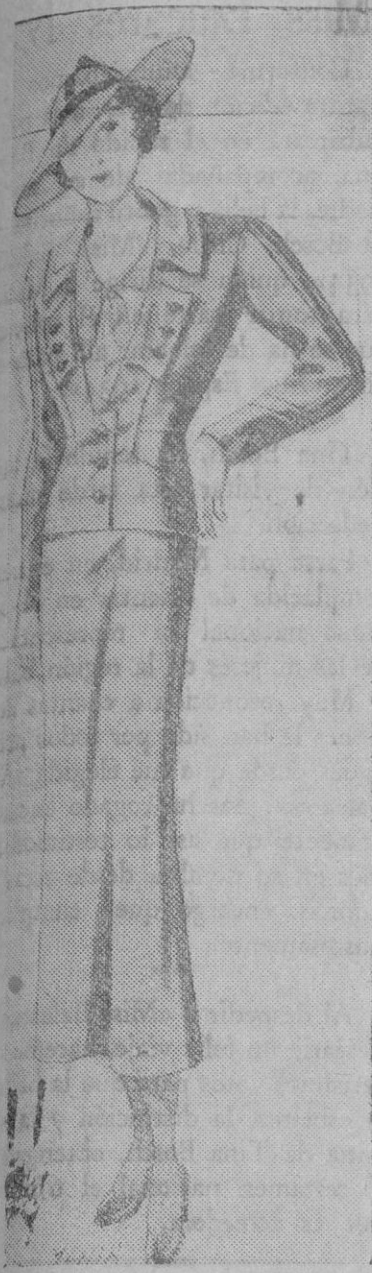
Vestido con pequeña chaqueta confeccionado en grueso tejido de hilo y botones de cristal azul