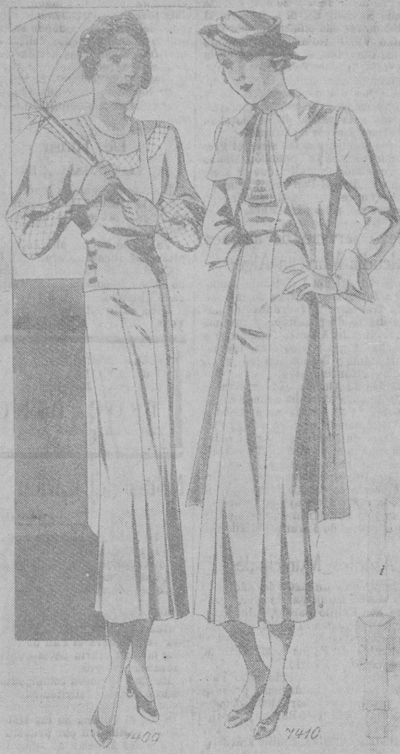
1.º Juvenil vestido en finísima lanilla blanca, combinado con seda escocesa y botones de madera