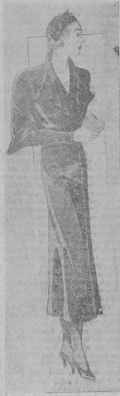
Bonito abrigo en satén brillante rojo