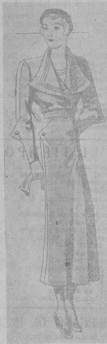
Abriquito tres-cuartos en lanilla gris