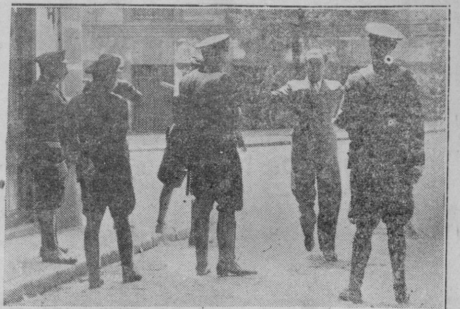
MADRID. — Los sucesos de la Facultad de Medicina