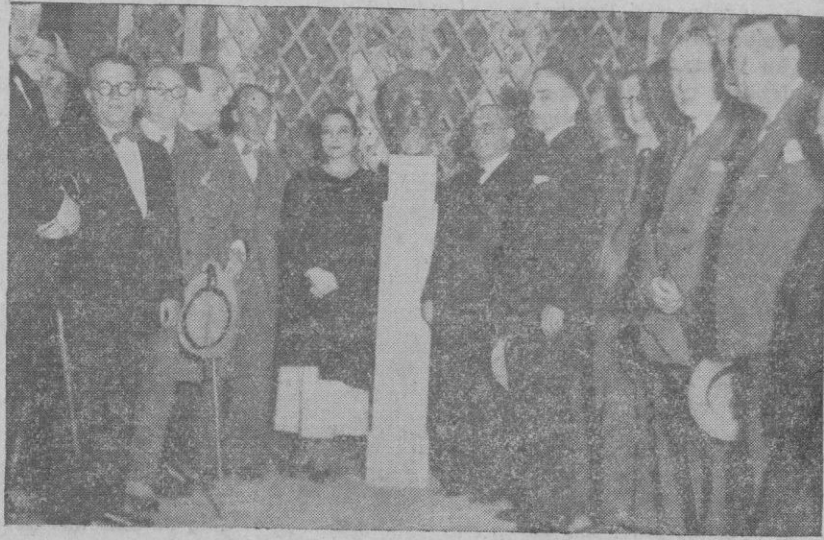
EL HOMENAJE A RUSIÑOL

Esta, como hemos dicho, debe empeñarse en desterrar de los pisos de nuestras calles el afirmado de terrisco, porque ya no sirve. El tránsito de los modernos vehículos lo quebranta apenas hecho. Es necesario dotar a todas las vías públicas de un piso más resistente. Así conviene a la comodidad del vecindario y a los propios intereses de la administración comunal.