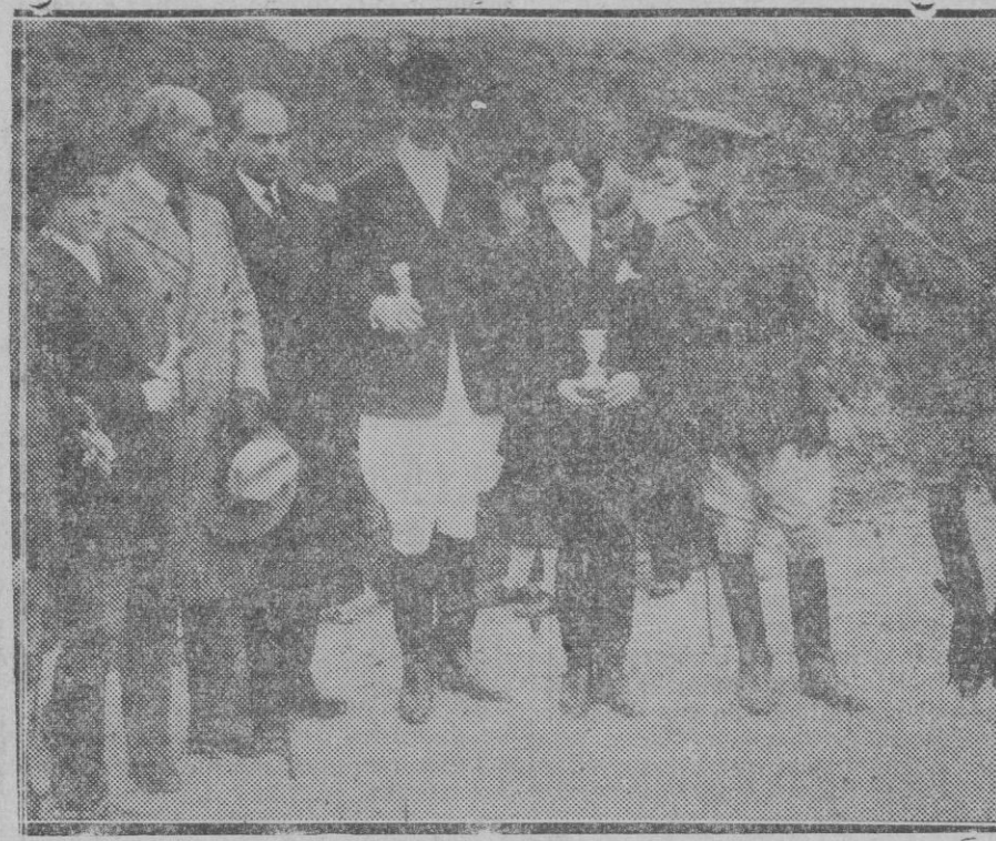
Deportes hípicas en Barcelona.—Los vencedores del concurso de saltos celebrado en la pista de polo del «Jockey Club»

Estos reparos del lugar designado para la celebración de la Exposición que hoguera ha de tener lugar, son los que motivaron que el Ayuntamiento negara su subvención a los organizadores, decisión ésta que impugnáramos si no la consideráramos justificada por los motivos expuestos, motivos sobrados a nuestro entender para justificar los reparos formulados, reparos que deseáramos que la entidad organizadora tuviera en cuenta, y que los atendiera a fin de que su gestión a este respecto si no en esta ocasión, en ocasiones venideras, se oriente en forma satisfactoria para todos, y dada la finalidad de esas Exposiciones logre de nuevo el apoyo de todos a fin de que pueda desarrollarse con éxito cada vez mayor.