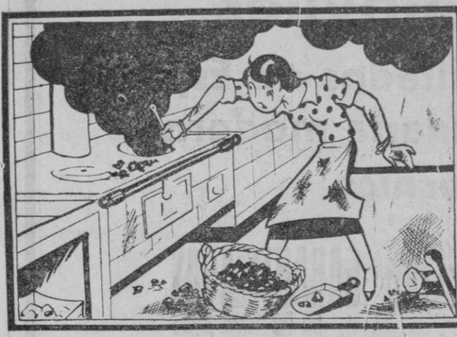
ELLA: Si no fuera por esta cocina la vida sería más agradable.

"Informado ante Presidente Ministros Gobernación Estado Hacienda