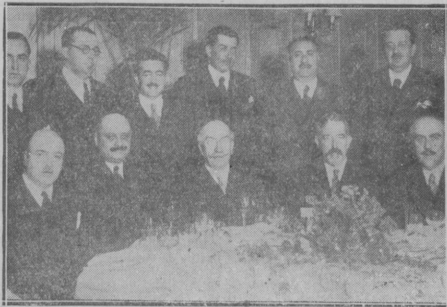
MADRID. — Los miembros del Comité ejecutivo del partido radical reunidos en una comida