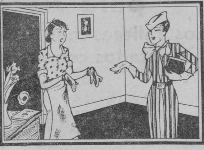
ELLA: Fíjate lo sucia que me encuentro, llevo rato batallando con la cocina. AMIGA: Por eso, yo aproveché la CAMPAÑA ANUAL DE GAS Y ELECTRICIDAD y tengo tiempo para todo.