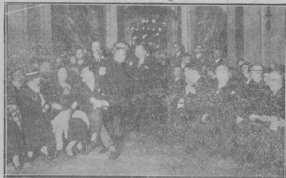
Los congresistas de IX Internacional de Química durante la recepción en el Ayuntamiento de Madrid