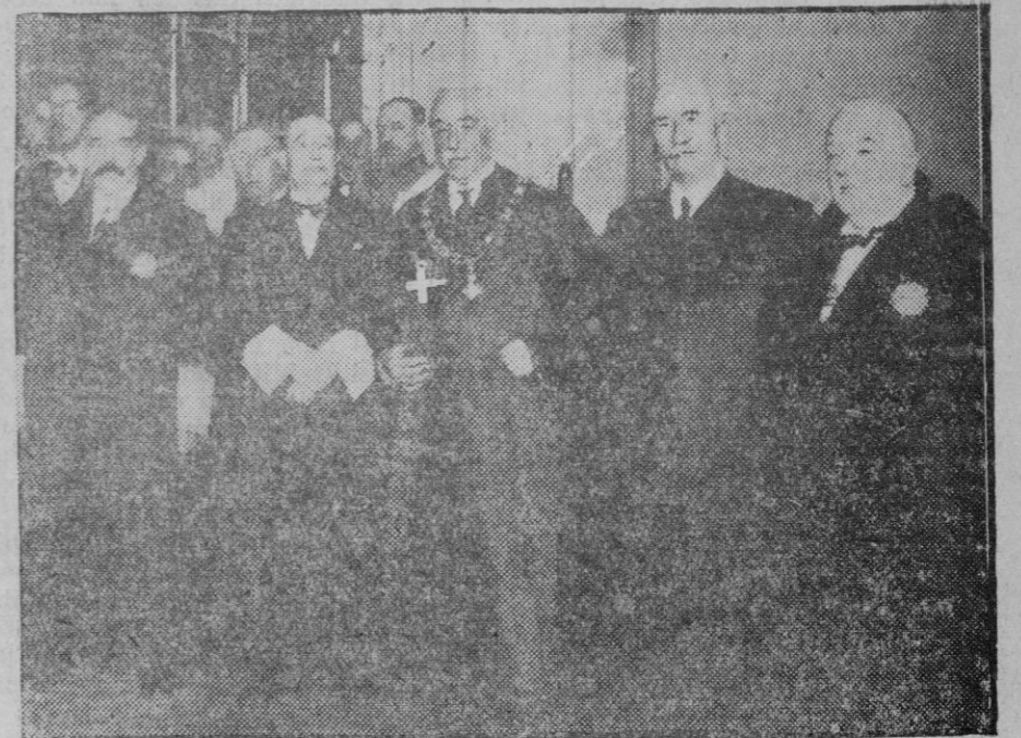
Grupo de autoridades que concurrieron al acto conmemorativo del centenario de la creación del Tribunal Supremo con asistencia del Pte. (x) de la República.