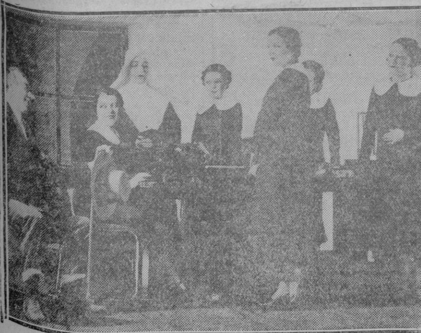
MADRID. — Una escena de la obra «Sor Alegría» estrenada en el teatro La ra con gran éxito