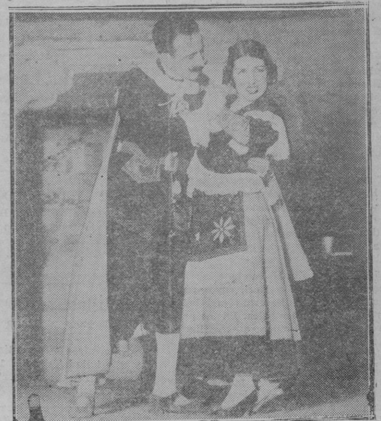
MADRID.—Una escena de la obra "La moza esquivada", que se estrenó con gran éxito en el teatro Fuencarral

En estas circunstancias, las Cámaras del Libro, inician su obra de reconstruir en un solo cuerpo de catalogación, la publicación bibliográfica de los treinta primeros años del siglo presente. Inicialmente, se puede atribuir a este intento un propósito mercantil, puesto que editores y libreros pueden obtener un beneficio material, un aumento de ventas, con la publicación de este catálogo. Lo que no se puede atribuir a afán de lucro, es la iniciativa de incluir en esta catalogación a todo el libro hispánico; a todos los libros impresos en los países de habla castellana. De los 37.055 libros que van catalogados en los dos tomos aparecidos, más de la mitad se imprimieron en América. No están estos libros en los almacenes de los editores ni en los anaqueles de los libreros españoles. A ningún industrial ni comerciante español le producirá el menor beneficio haber realizado esta costosa investigación y la impresión de tantas páginas dedicadas a libros inexistentes en España. Así, pues, el empeño aco-