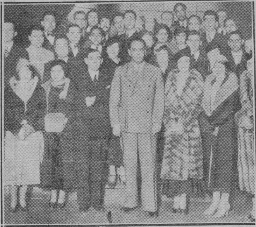
MADRID. — Puerto Rico y España. — Homenaje celebrado en el Hotel Nacional en honor de los estudiantes portorriqueños

—¡No le llares tan fuerte, que te va a contestar!