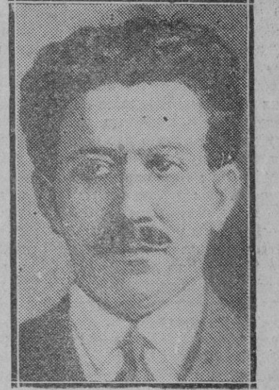
EXTRANJERO. — El aventurero judío Alejandro Stavisky cuyas estafas ascienden a más de 300 millones de francos y que se pegó un tiro al ser detenido

Otro problema que con caracteres de urgencia, se presenta ante los ojos de gobernantes y legisladores, es el agrario. España necesitaba una reforma de su ordenación jurídica de la agricultura. Se hacía preciso trastocar todo el viejo sistema. La iniciativa de las Cortes Constituyentes fué noble, elevada, oportuna. Pero, ¿fué, al mismo tiempo, acertada? Cerca de dos años lleva en vigor la ley de Reforma Agraria y sus resultados no han dado el margen de eficiencia que fuera de desear. Ha sido contraproducente en muchas de sus formas de aplicación. Se ha empeorado la situación económica del campo, sin beneficio para nadie. El Gobierno considera que es necesario revisar esa ley y orientar sus preceptos en forma que permita alcanzar lo que se quería. Habrá que ir a una nueva Reforma agraria en la que se recojan las enseñanzas derivadas del ensayo realizado en estos dos años. Hay que fortalecer a la pequeña propiedad y para ello se necesita suprimir el sistema de asenta-