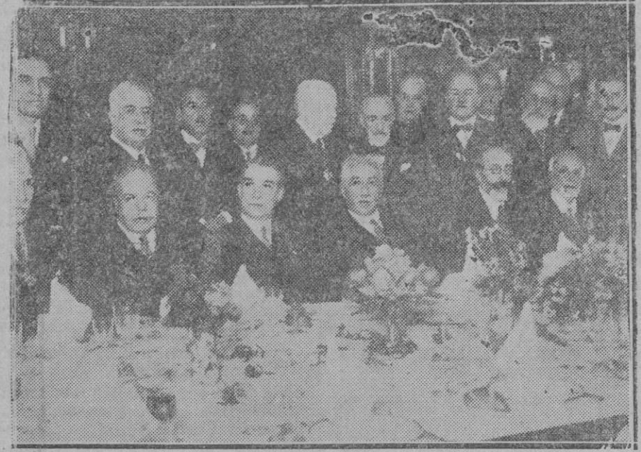
MADRID. — Los Académicos Españoles presididos por el Sr. Alcalá Zamora en el banquete celebrado en Casa Labardi

Pero esto, dicho así, es un rumor nada más. Para ver qué consistencia puede tener, he corrido el cantaro de mis cuartillas, y lo he arrojado a una fuente: una persona equidistante de ambos organismos que cuenta con influencia en los dos. Y esta persona, ya que no muy explícita, ha sido muy amable. — Hay "acercamiento." — le he dicho. — Hombre, sí, lo hay, y es natural que lo haya. Después de todo, es justo que a la alianza de las dere-