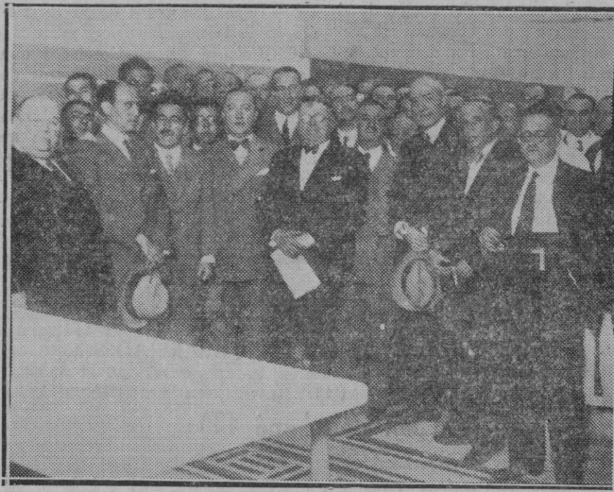
MADRID. — Inauguración de las cocinas de la Diputación Provincial

El estado cada vez más precario de esta industria y la necesidad de buscar solución al conflicto que ello supone, ha de mover a todos, autoridades, corporaciones y diputados, a pugnar con empeño para conseguir aquellas posibles aspiraciones señaladas por los propios elementos de la industria, que pueden conjurar la crisis que este factor tan importante de nuestra economía viene atravesando.