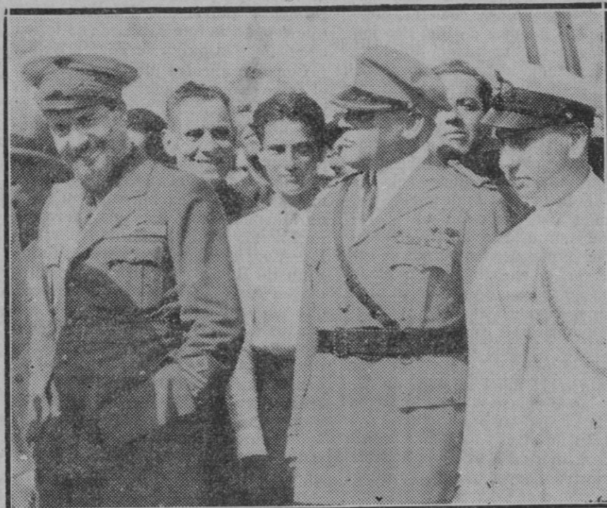
LISBOA. — LA LLEGADA DE BALBO.—Honrie el general, en los momentos del desembarco, ante el éxito incomparable de su empresa de aviación al frente de la escuadrilla italiana

Si a más de estas conveniencias, tan fácilmente apreciables, se registran en el tráfico de pasajeros en la expresada línea cifras tan importantes como la registrada ayer, ¿con qué razón se nos podrá negar la mejora que pretendemos?