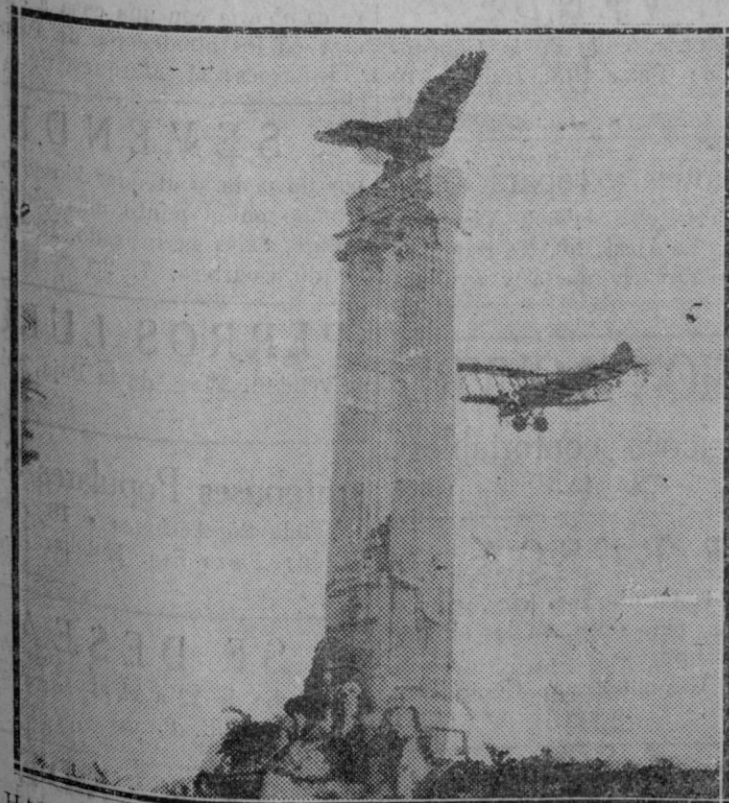
HABANA. — DIAS DE REVOLUCION.—Un avión militar del servicio de vigilancia sobre la ciudad, volando junto al Monumento a los Mártires de la Independencia