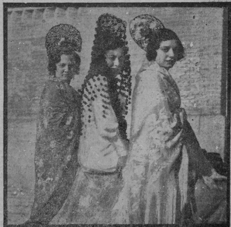
MADRID.— Tres gentilísimas presidentas de la becerrada celebrada por los chófers en la Plaza de Toros.

De vez en cuando, al hablar un estadista de primera fila—en estas últimas semanas, por ejemplo, Norman Davis o Paul-Boncour—, se "filma", una película sonora. Davis y Boncour se sientan uno al lado del otro, el norteamericano con su pipa curvada, y el francés fumando cigarrillos. Davis es un hombre sencillo, algo brusco, pero agudo y mordaz. Una de sus frases favoritas es: "Vamos a ver si la Conferencia se nos estalla en la cara...". Dice que en Norteamérica hay