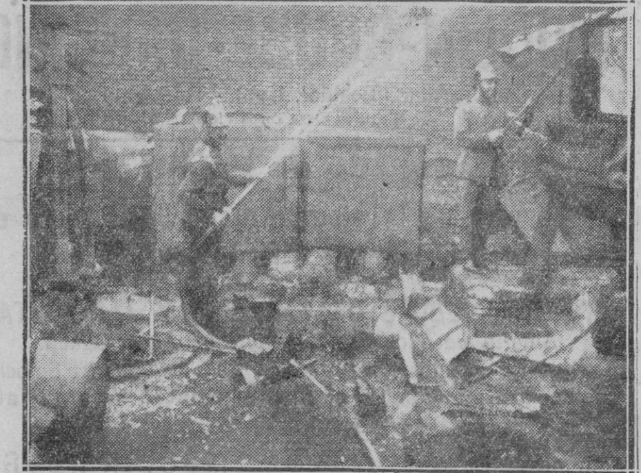
MADRID. — El incendio en una fábrica de alquitrán Canmanes. Aspecto que ofrecía la fábrica durante la extinción del fuego por los bomberos.

Hace pocos días aún, el Ministro de Hacienda de Francia, recién hundido