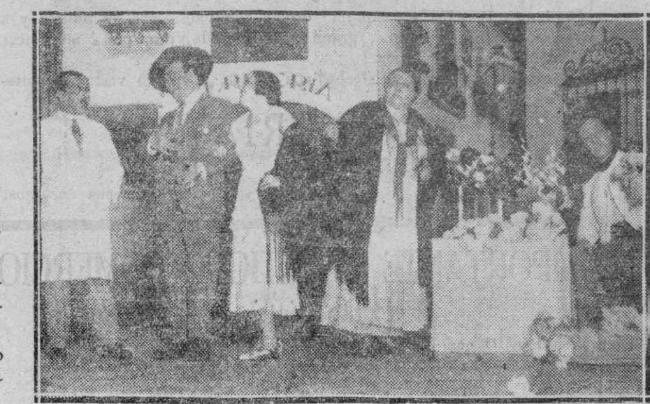
MADRID. — Una escena de la obra "El Espanto de Triana" que se estrenó con gran éxito en el teatro de la Zarzuela