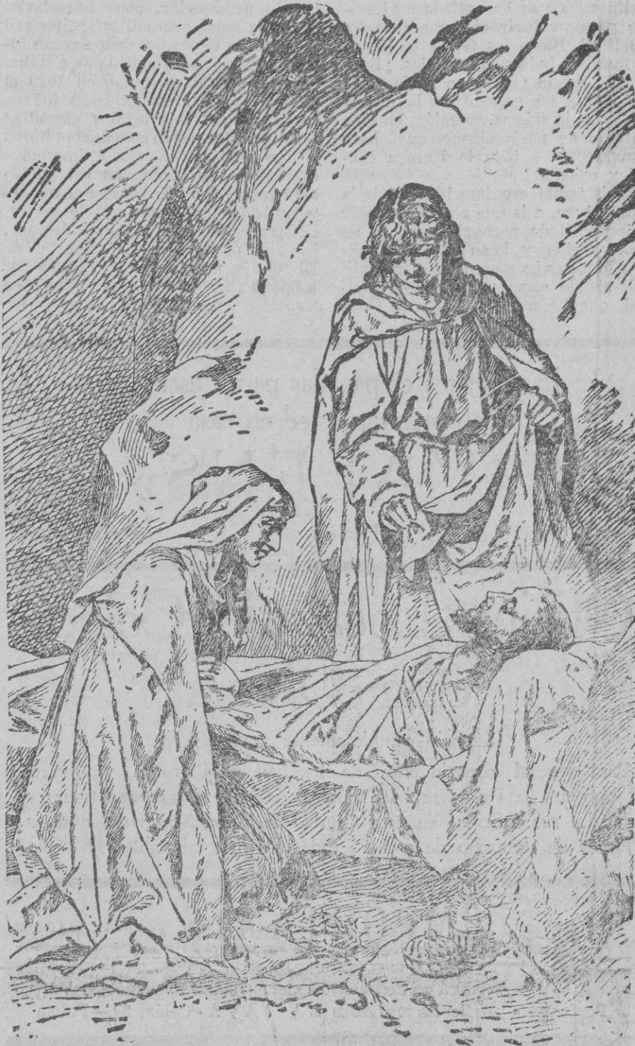
El cuerpo de Ntro. Sr. Jesucristo, descendido de la Cruz, es ungido antes de ser sepultado

pitalista o adinerado a todo el que disponga de mas dinero que él, unas veces cree lo que le cuentan y otras siente enriarse su comunismo instantáneamente cuando se entra de que el dinero, el "maldito dinero", o "el vil metal", lo mismo en Rusia que en América, que en España, es exponente de tan extrañas desigualdades.