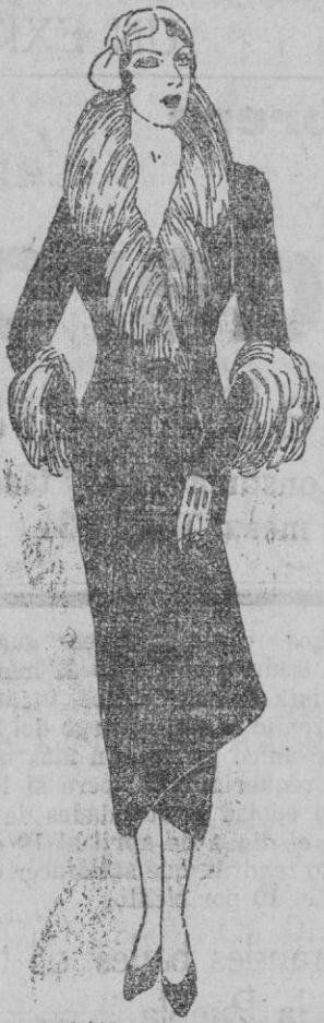
Elegantísimo abrigo en terciopelo de seda azul. Cuello y puños en renard (argent)