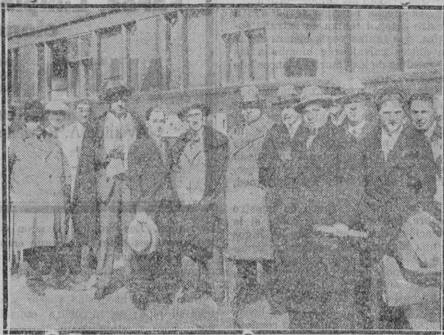
CADIZ.—Con motivo de los pasados sucesos de Casas Viejas y para esclarecer del alles han llegado a Cádiz una comisión de diputados y periodistas

Ahora bien, si los postulados del socialismo son dogma intangible y objetivos de realzación, sobre su intento de restaurar aquella cultura. Una y otra se excluyen mutuamente, sin término de conciliación. Sabríamos si el señor Azafia habia pensado bien su discurso si este fuera un programa; pero nada se nos ha dicho sobre los propósitos concretos del Gobierno. Pero sus amigos, y el mismo, recuerdan la declaración ministerial como el manifiesto de la obra de Gobierno. Si no lo creyeran—decía—yo no tengo la culpa. Y sin embargo ni el Gobierno ni la opinión pública se enteraron del desorden social en pleno auge. Por que no basta decir que los obreros gritan