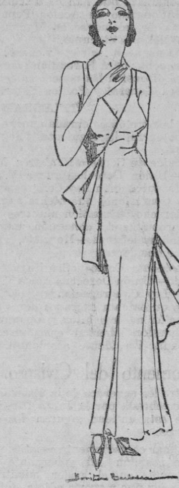
Sobrio y elegante traje de noche en crespón georgette marrón claro