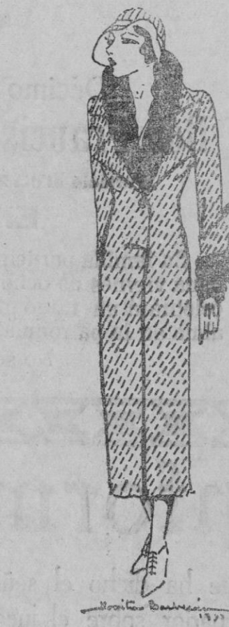
Elegante abrigo en diagonal fantasma de lana gris. Piel de castor

Se duermen las incommensurables montañas, y duerme el cielo verde claro sobre la tierra, muda por siempre jamás.