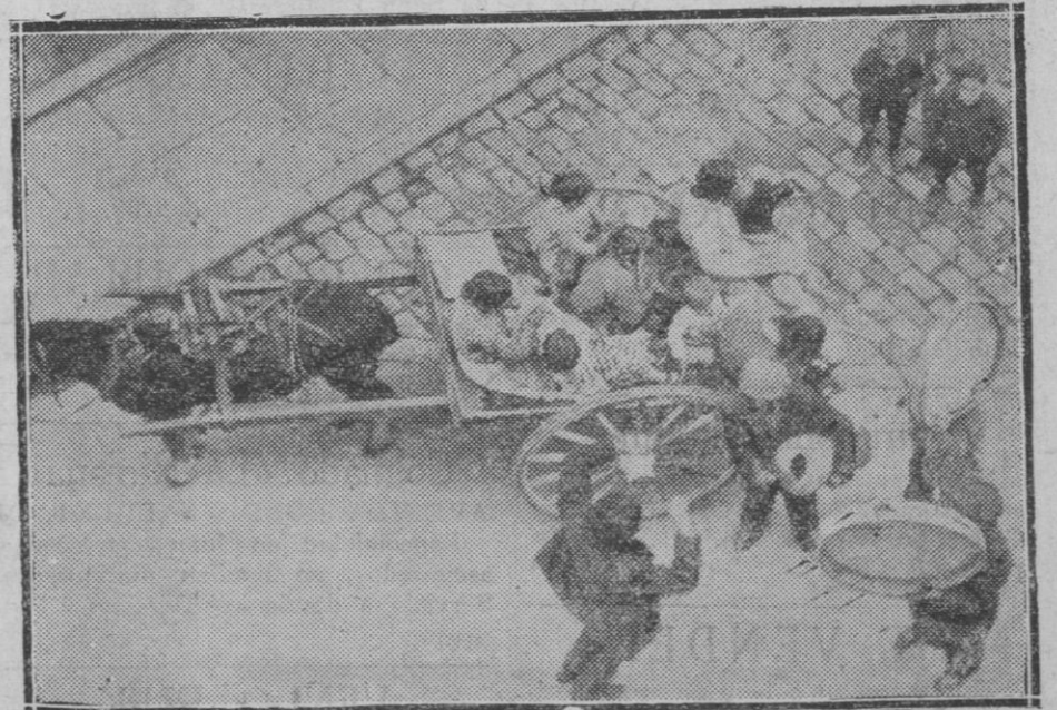
MADRID.—Una carroza en la tarde de Nochebuena que circula por Madrid, haciendo ruido y divirtiéndose