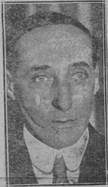
MADRID.—El nuevo ministro de Suiza en Madrid señor Charles Egger que ha presentado sus cartas credenciales al Presidente de la República