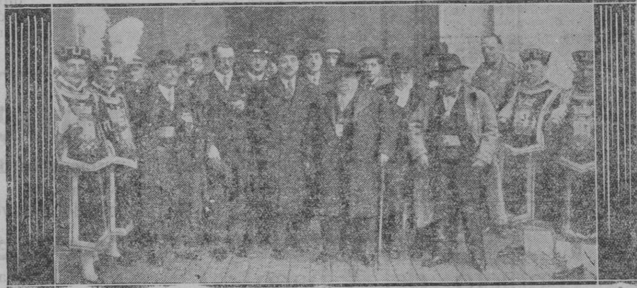
MADRID.—El Ayuntamiento saliendo del Palacio Nacional después de su felicitación al Jefe del Estado por el aniversario de la promesa

Frecuentemente la verdad se vuelve contra aquel que la dice.—Maquiavelo, prenderle del anuncio de "Sevends".