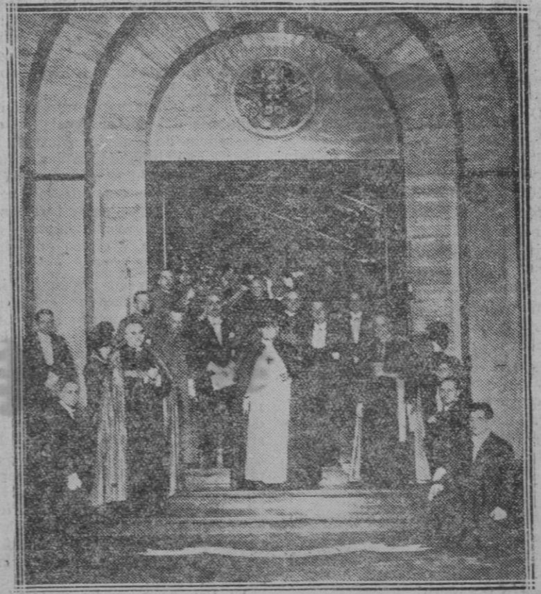
ROMA.—Con imponente solemnidad han sido inaugurados por Su Santidad Pío XI los nuevos museos del Vaticano. Momento de salir el Papa de dicho edificio.

Porque el grave error de las gentes es creer que el Bachillerato tiene por misión fundamental aprender algo. No. Todos los que han pasado por los Institutos saben bien que no se aprende.