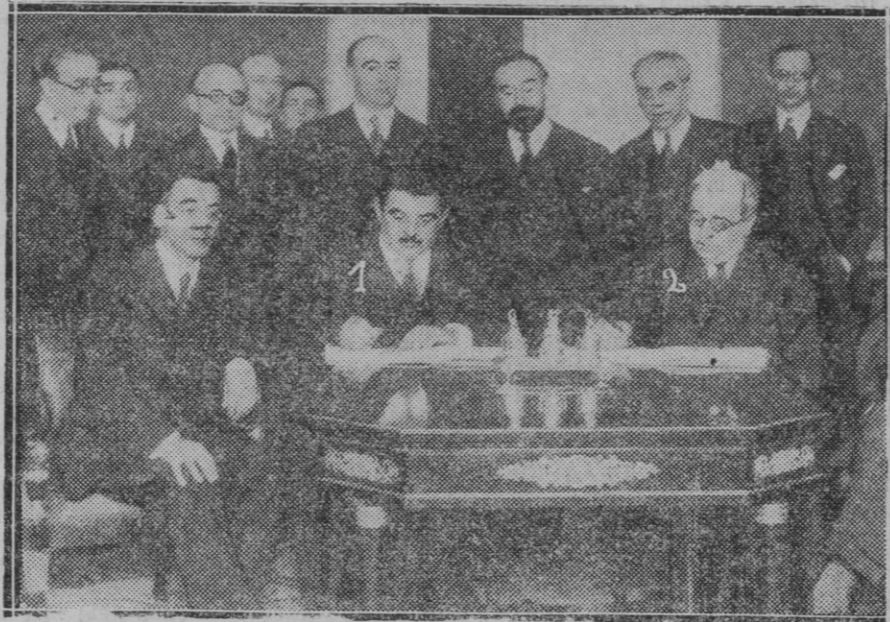
MADRID.—Mr. Herriot y Azaña firmando los tres tratados entre Francia y España