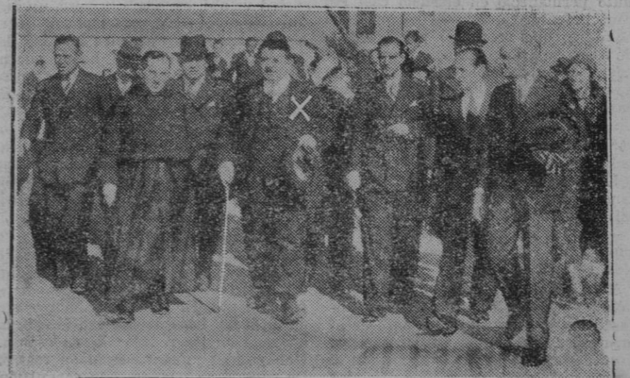
MADRID.—Herriot en su visita al Monasterio de El Escorial acompañado del Alcalde del Escorial y varias personalidades y el Embajador de Francia

Bloqueado el puerto exportador de Santos, utilidades en transportes militares los buques dedicaban normalmente al tráfico cafetero en Río Janeiro, cesó la exportación y el precio del café subió en todo el mundo. En Nueva York el precio de 4 y medio ascendió hasta 9 y medio. La "Federal Farm Board" dobló el valor de los 62.500 sacos que mensualmente puede vender, del millón de sacos que pagó con trigo,