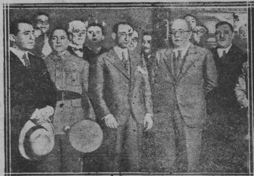
El Jefe del Gobierno, con el ministro de la Gobernación, durante su estancia en La Coruña, acompañado de las Autoridades locales