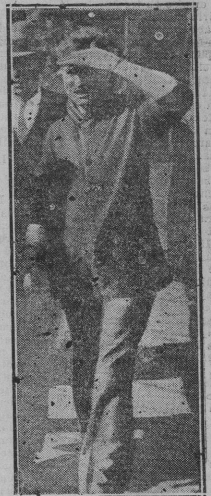
Extranjero.—En la foto aparece uno de los escasos supervivientes que resultaron levemente heridos a causa de una explosión ocurrida en el navío «Observación» anclado en el río East, de Nueva York que motivó la muerte de 40 obreros y causó más de 50 heridos

Acaso el trabajo más arduo del detective es la vigilancia, es decir, seguir los pasos de ciertos criminales y frustrar sus tentativas. Esto exige una gran tenacidad y previsión, así como también un poderoso esfuerzo físico, pero, por encima de todo, requiere el poder tomar decisiones rápidas para salir airoso de situaciones difíciles. No hay mayor prueba para un hombre, que esta clase de trabajos y el buen detective debe saber combinar la energía en cierto sentido humorista y en todo momento utilizar el "bluff". Nunca ha de perder la cabeza.