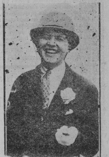
CANNES. — La célebre amazona que hace algún tiempo realizó los "raids" hipicos Paris-Bucarest, Paris-Berlin, Paris-Roma, Paris-Barcelona y Paris-Cannes, que ha intentado suicidarse con nevonal en un hotel de Cannes

No hay duda, de que Japón puede, si quiere, invadir con armas varios países de poca densidad de población y conquistarlos, con algunas probabilidades de éxito. Realizado esto, podría inducir a su exceso de población para que se instalara en los territorios conquistados. Pero hay razones para dudar que Japón, adopte esta política, por difícil que sea su situación. Ello conduciría a una guerra inmediata, con violenta resistencia, mientras que la política de capturar mercados puede llevarse a efecto sin guerra. Además, y esto no puede ser ignorado por los calculadores nipones, el encauzar una emigración por vía marítima, y aumentar los emigrantes en los territorios ocupados, es una labor inmensa. Aun cuando se lograra que unas cuantas decenas de millones de japoneses abandonaran el archipiélago, el problema seguiría subsistiendo, porque el incremento anual de la población nipona es casi de un millón de almas. Después de la guerra ruso-japonesa, los japoneses tuvieron la oportunidad para ocupar Corea y Mandchuria y no quisieron aprovecharla. Solo unos cuantos miles de japoneses cruzaron el estrecho... Las razones fueron muchas. Una de ellas, que los japoneses son