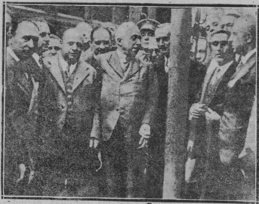
Durante su estancia en Alsasua (Navarra). El Presidente de la República señor Alcalá Zamora con el ministro de Estado y Obras Públicas y autoridades de la provincia.

no lo hemos notado. Estas palabras podrían sugerir varias interpretaciones. Pero descartamos, por lo pronto, la conjetura de una falta de sensibilidad para sentir los problemas y los afanes del momento. Lo que ocurre, sin duda, es que Mallorca tiene su "estilo", propio para arrostrar las contingencias de la vida. En todo isleño hay siempre un punto de reserva que el hombre continental no acaba de comprender del todo. Lo cierto es que en esta hora conmovida, nerviosa y un tanto angustiada del mundo es cuando más se destaca esa calma, ese ordenado y tácito vivir que hacen de Mallorca, con los incomparables encantos de su