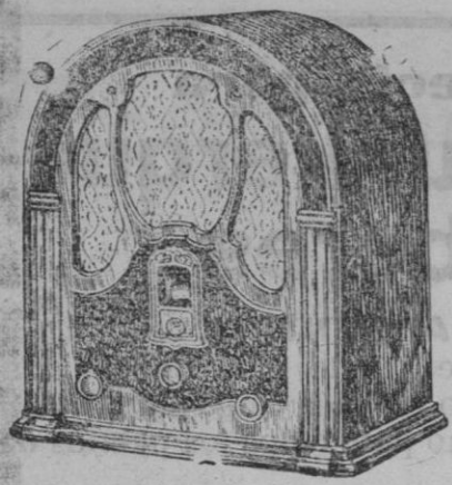
MODELO W R-17