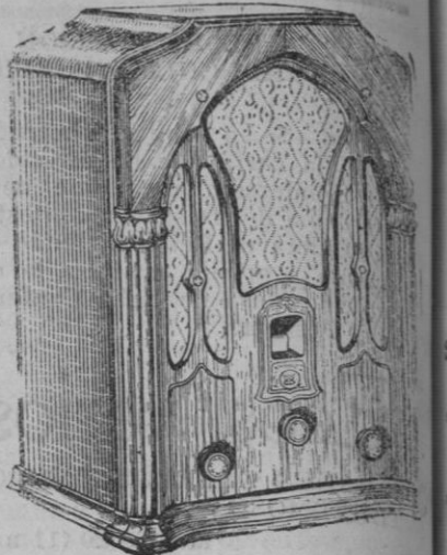
MODELO W R-18