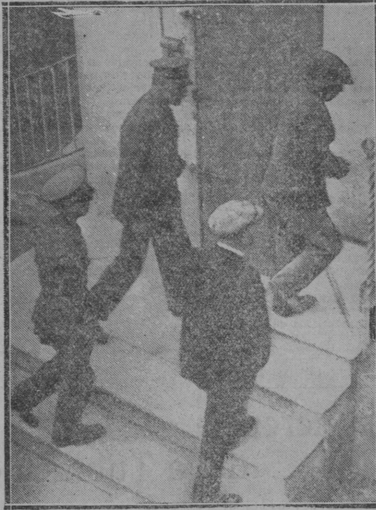
TARRASA. — (Barcelona).—El asesino del niño de 3 meses y que le mató chupándole la sangre, en la foto al ser conducido por los agentes de la autoridad

Es ello de absoluta necesidad. Sin conseguir esta pavimentación la administración municipal no podrá con-