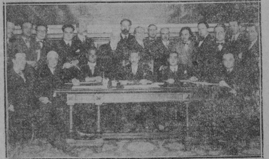
MADRID.—El Estatuto Catalán.—Deunión de la minoría catalana en Congreso para tratar del próximo debate del dictamen relacionado con dicho asunto

es el alimento ideal para los niños, ancianos y enfermos.