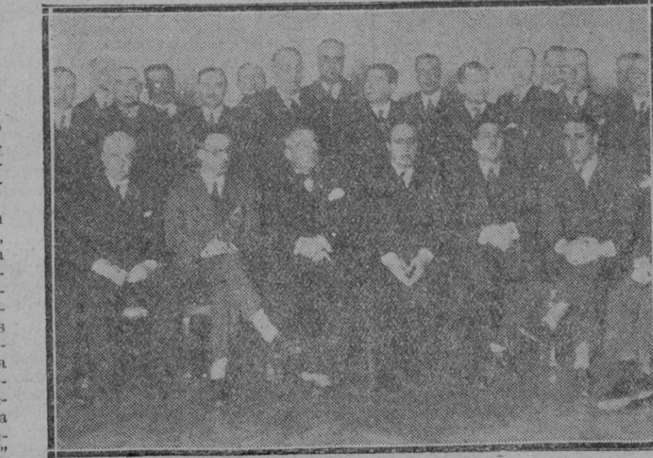
MADRID.—En la casa de la Prensa.—Sexta Asamblea de la Federación de Empresas Periodísticas de Provincias celebrada en dicho edificio.