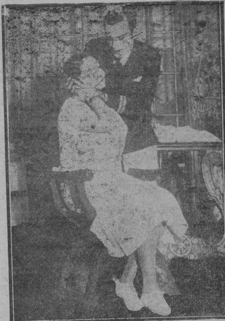
MADRID.—Una escena de la obra "El Cuarto poder", estrenada en el teatro Beatriz por la Compañía de Camia Quiroga

Huelga decir con cuanto agrado vemos las gestiones que a tal fin viene haciendo la Corporación Municipal, y cuán sinceramente la alentamos para que prosiga en su intento.